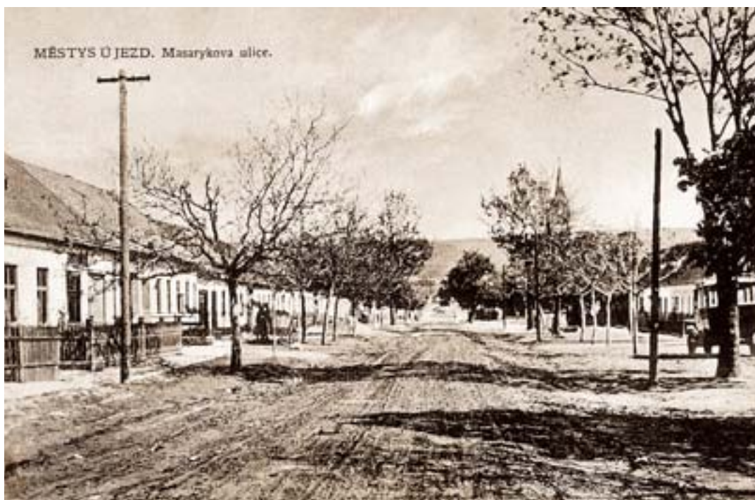
Stavba silnice na Komenského ulici