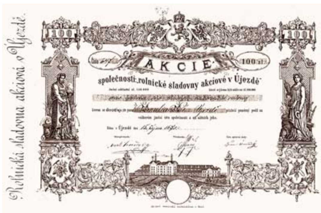
Dobový obrázek místní sladovny