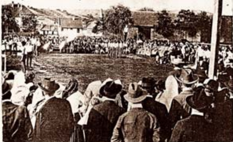
Veřejné cvičení „Sokolů“ v Újezdě u Brna 21.8. 1909.