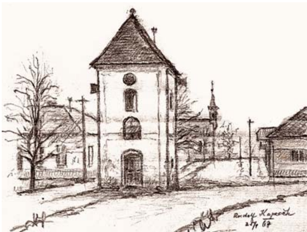
Rudolf Kopeček – Šulákov č. 37, červen 1990