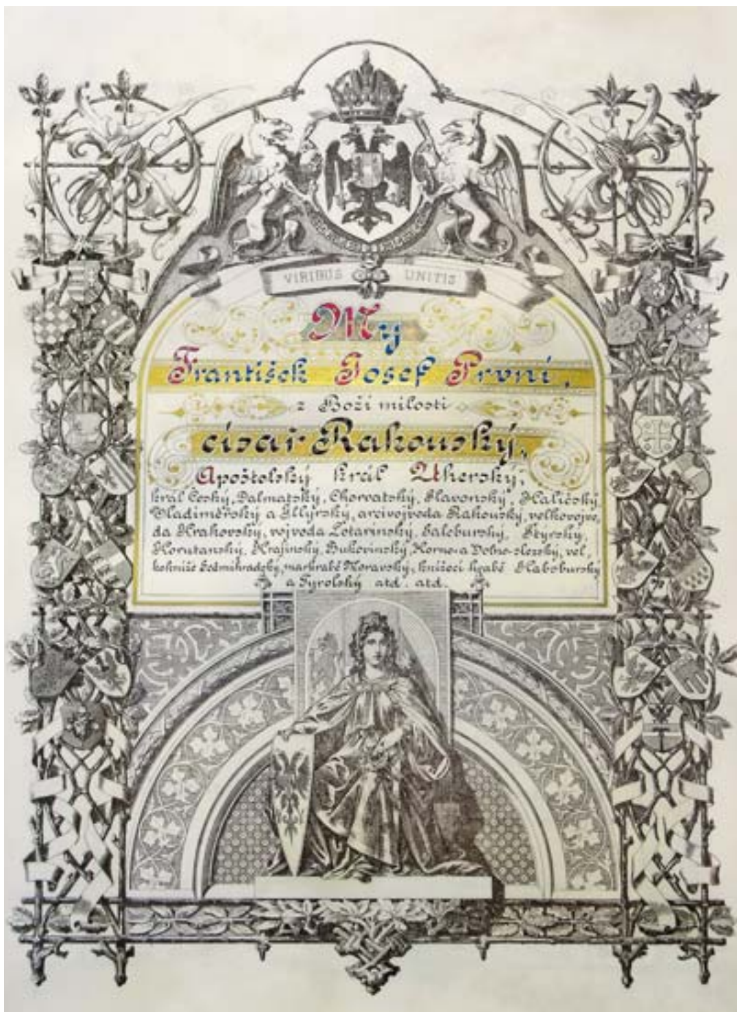
Dekret – František Josef I. povyšuje Újezd na městys. 15. září 1909 Vídeň