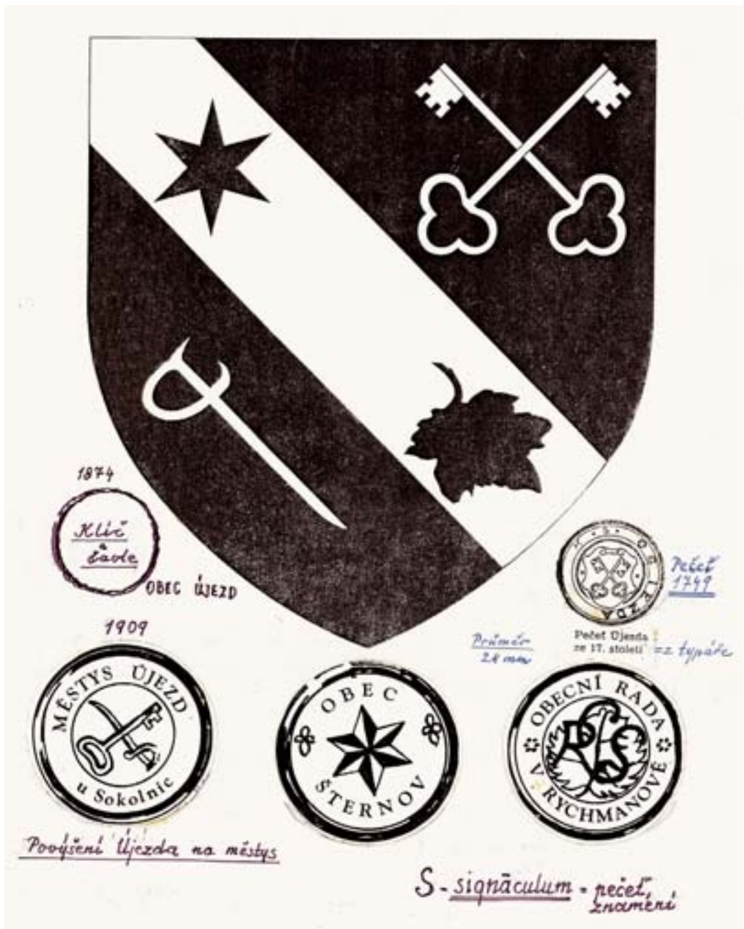
Znak a pečeti obcí z různých let: Šternov, Rychmanov, Újezd u Sokolnic