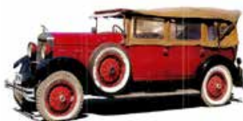
Praga Mignon vyrobená v licenci v polské Osvětimi (1928) Praga Mignon, produced under licence at Auschwitz, Poland (1928) Praga Mignon - hergestellt in der Lizenz im polnischen Auschwitz (1928)