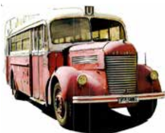
Autobus Praga NDO (1948) Praga NDO bus (1948) Autobus Praga NDO (1948)