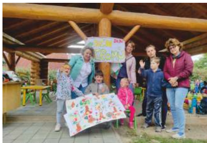
Den stromů s dětmi z domova LILA