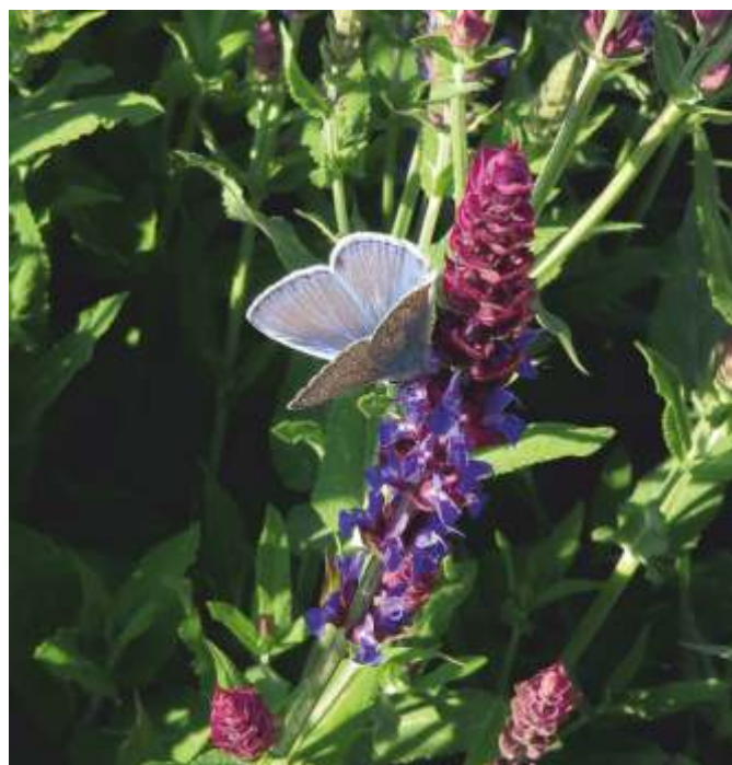
Sameček modráška jehlicového ( Polyommatus icarus ) se občerstvuje na šalvěji hajní.

Na zahrady je lákáme, ale motýlů přesto neustále ubývá. Ze 160 druhů denních motýlů v Česku jich už 18 druhů vyhybnulo a další polovina druhů je