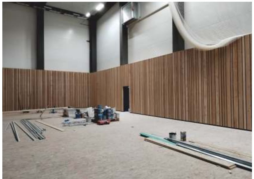
Obložení stěn sportovní plochy