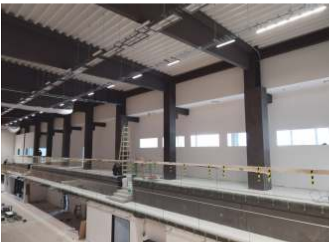
Pohled na tribuny