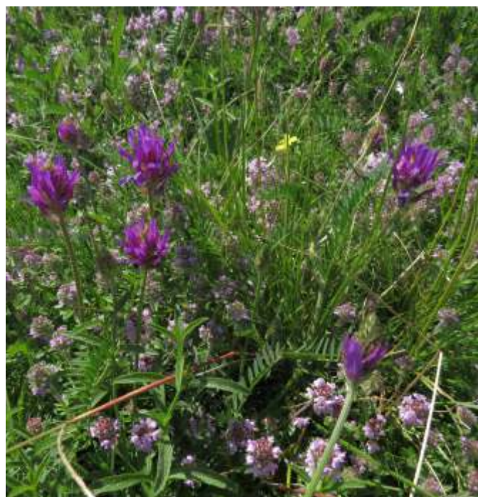
Pestrý luční porost je pastvou jak pro dospělé motýly, tak i jejich housenky.