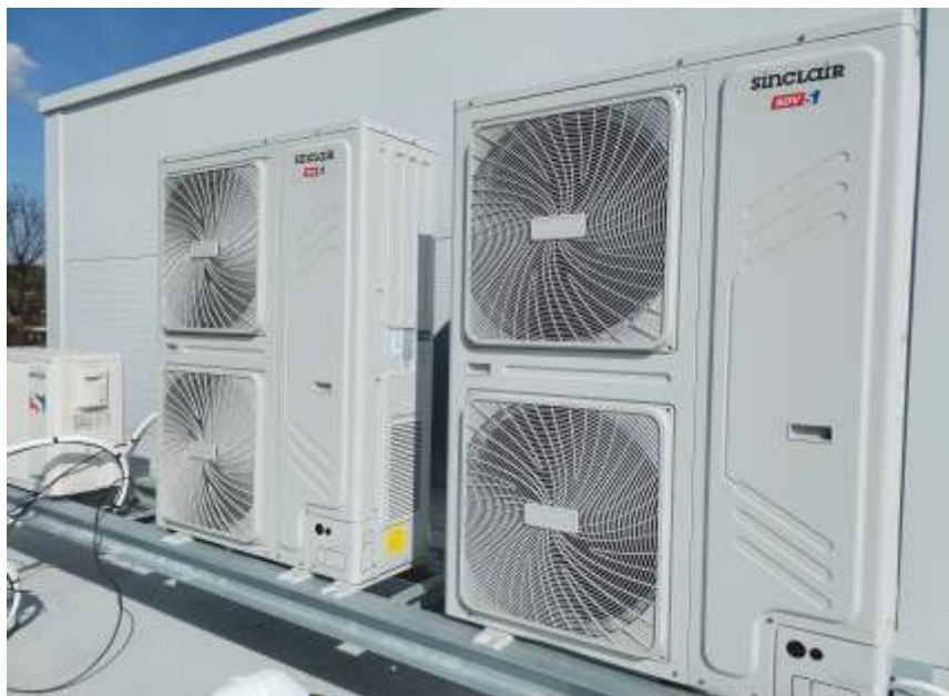
Vzduchotechnika na střeše