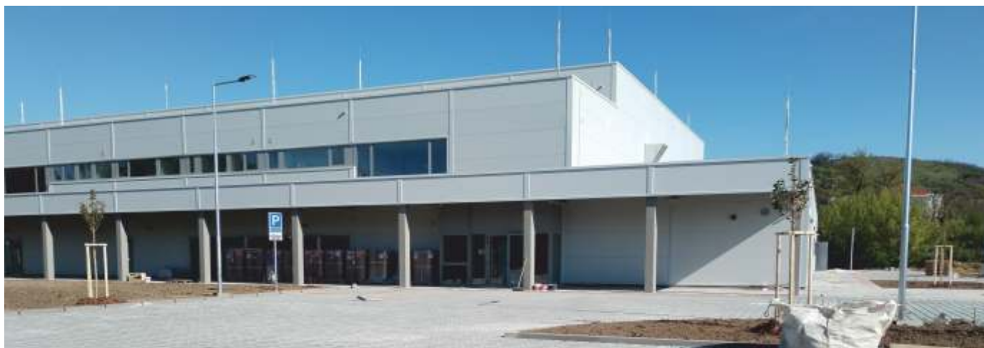
Pohled na jižní stranu