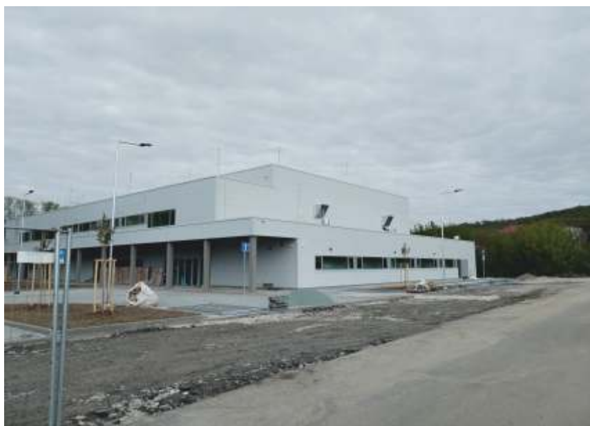
Pohled na východní stranu