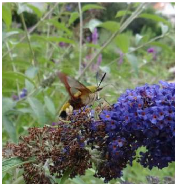
Dlouhozobka zimolezová (Hemaris fuciformis) na komuli Davidově.