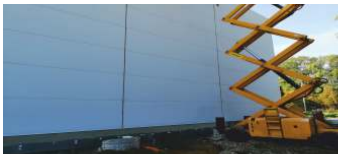
Montáž obvodových panelů