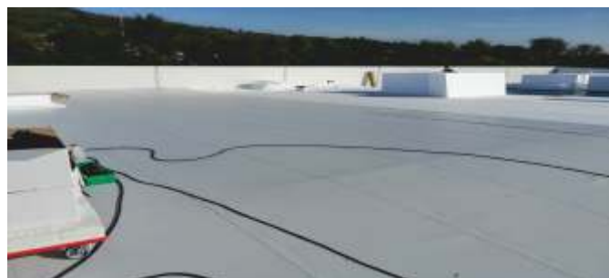
Montáž střešního pláště