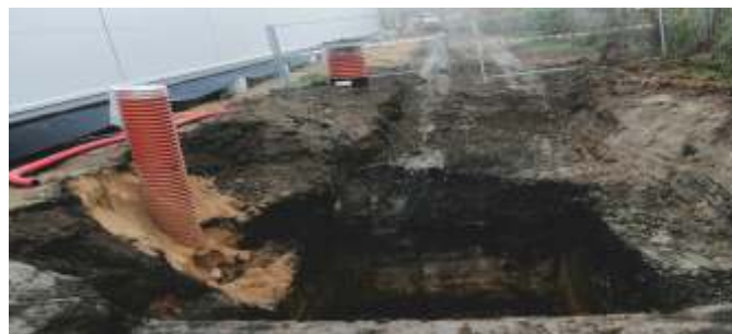
Příprava přečerpávací stanice