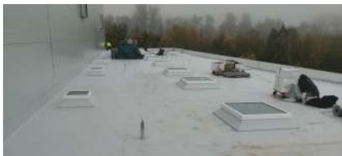
Montáž střechy ve 2. NP