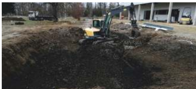
Příprava retenční dešťové nádrže