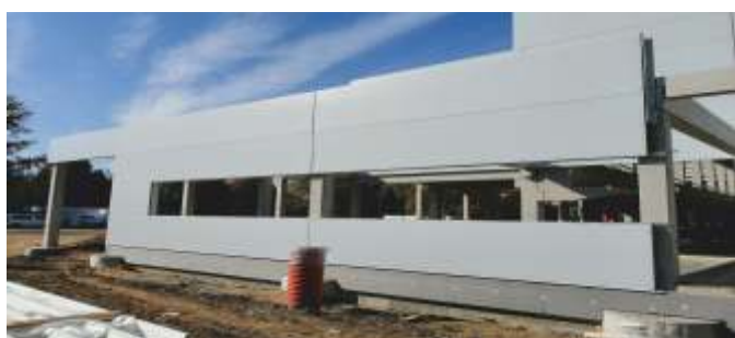
Montáž ocelové konstrukce pro okna a dveře