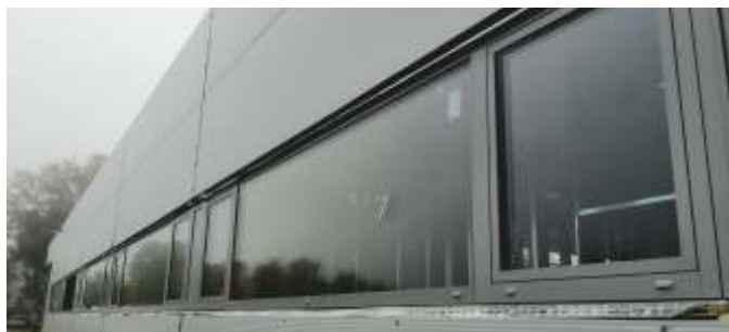
Montáže oken v 1. NP