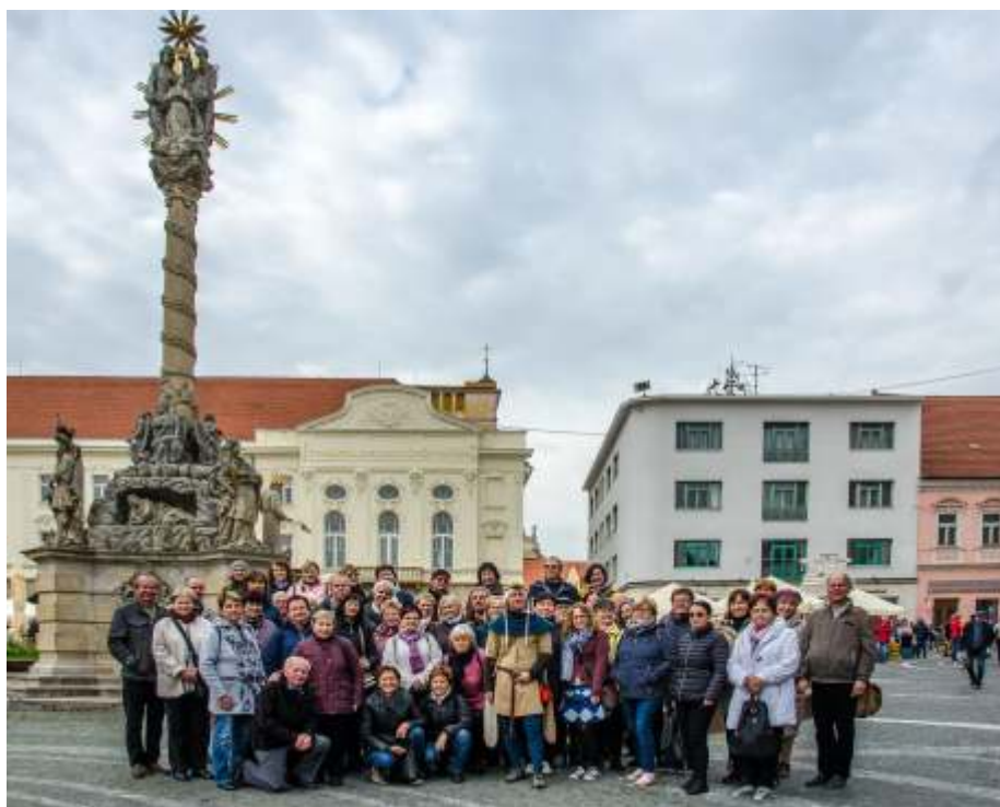
Mobilní univerzita v Trnavě

Město Nitra má také velkou historii již od 9. století, spojenou s Velkou Moravou. Město leží na sedmi pahorcích, podobně jako Řím. Navštívili jsme hrad, který je součástí biskupství, katedrálu, kasematy a hradní věž. Cestou jsme naslouchali přednášejícím o historii Velkomoravské říše, sv. Cyrilu a Metoději a o vzájemné provázanosti Čechů a Slováků.