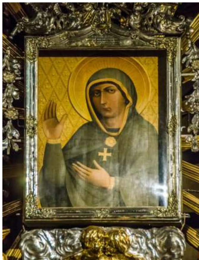
Zázračný obraz Panny Marie Trnavské

V říjnu jsme jeli do Trnavy a Nitry. V Trnavě jsme prošli s průvodcem centrum města a seznámili se s jeho historií. Trnava, slovenský Malý Řím, má dlouhou tradici. Zajímavostí je, že jako první na Slovensku dostala privilegia svobodného královského města. Ve středověku dokonce patřila mezi největší gotická města střední Evropy. Její křesťanské dějiny se začaly psát již v 16. století, kdy sem přesídlilo ostráhomské arcibiskupství a kapitula. Od těch dob se Trnava stala střediskem náboženského, společenského a kulturního života