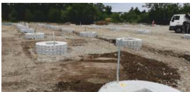
Betonáž hlavic, zemnicí pásy