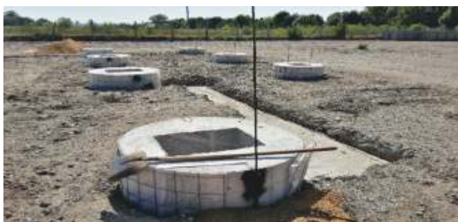
Betonové hlavice pilot vč. Spojení zemnicích pásků