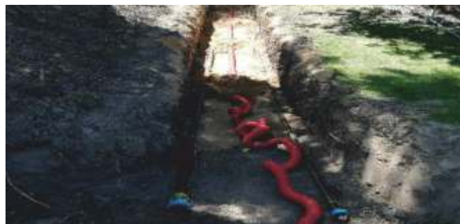
Přípojky přes park