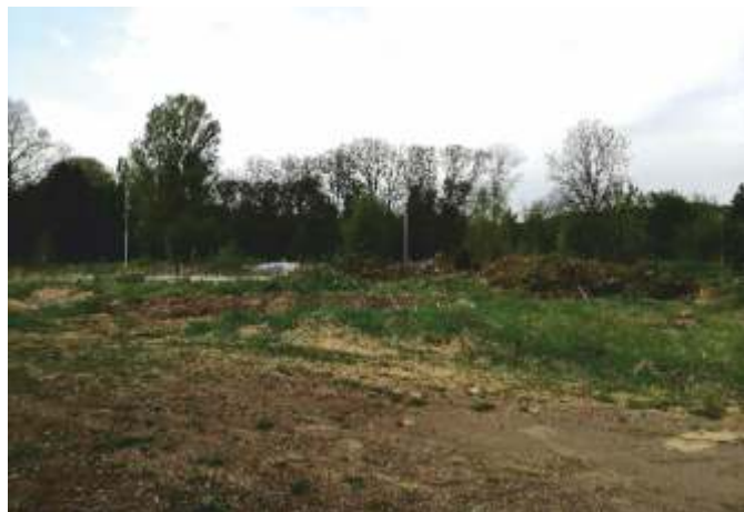
Staveniště před zahájením prací