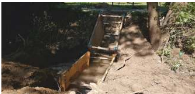
Příprava pro přípojky přes mlýnský náhon