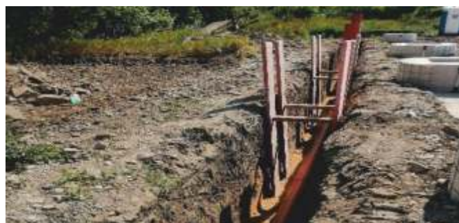
Výkopy - pokládka ležaté kanalizace