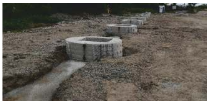
Spojování zemnicích pásek