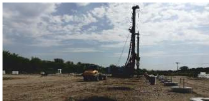
Vrtání a betonáž pilot