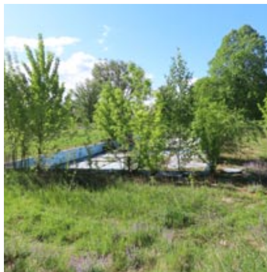
Současná podoba koupaliště

O činnosti TJ Sokol a jednotlivých oddílů bylo psáno v minulém čísle zpravodaje. Samozřejmě celý rok byl pro nás klasicky cvičebním a letos také rokem XV. Všesokolského sletu, na kterém se naše sestry a bratři aktivně podíleli, část vystoupení i s přespolní účastí bylo předvedeno i přímo na hřišti za Sokolovnou v září, bohužel ne s takovou účastí návštěvníků, jaké by si zapálení i více jak 90-ti letých cvičenců zaslou-