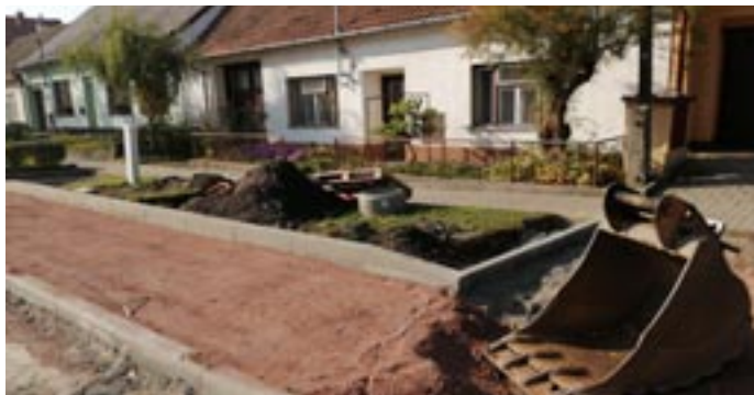
Práce na průtahu Rychmanovem

kanalizace, bylo vyměněno veřejné osvětlení. V současné době se na celém průtahu mění část zelených prostranství na trvalkové záhony. Opravili jsme veřejné osvětlení na dalších 5 ulicích (Tyršové, Legionářské, Sušilové, v části ul. Hybešové a ul. Komenského). Byly vybudovány osvětlené přechody pro chodce na ul. Nádražní a Masarykova. Zrenovovali jsme ze získané dotace podlahu v tělocvičně základní školy, v letošním roce byl vyměněn povrch tenisového kurtu v jejím areálu. V základní škole se nám podařilo opravit v několika třídách elektroinstalaci a dokončili jsme druhou a třetí etapu výměny rozvodů vody spojenou s výměnou obkladů a výmalbou na toaletách a ve třídách.