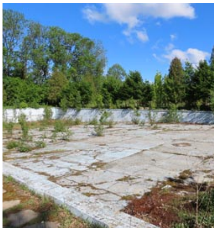
Bývalé koupaliště dnes