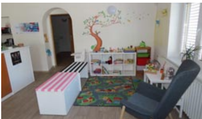
Dětský koutek v Mezigeneračním centru

Na radnici byla vybudována nová místnost pro spisovnu, probíhá přesun serveru do nových prostor tak, aby jeho umístění konečně splňovalo všechny předpisy, zejména ty požárně bezpečnostní. Plánujeme stěhování městské policie do budovy bývalého Telecomu tak, abychom mohli přesunout pokladnu do přízemí radnice a občané tak měli ke všem nejdůležitějším agendám bezbariérový přístup (matika, ověřování, podatelna, vybírání poplatků).