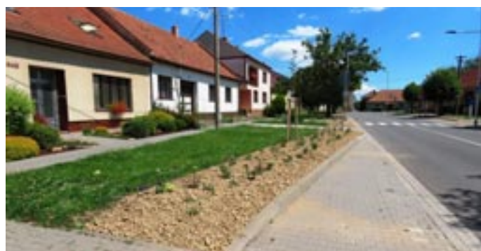
Průtah po rekonstrukci

luprací s kulturně-školní komisí, sociálně-zdravotní komisí nebo některými místními spolky a dobrovolníky spoustu akcí. Z těch nejúspěšnějších a nejzajímavějších bych vyzdvihla Újezdské kulturní léto, v rámci kterého je pořádáno 5 koncertů v parku u Penzionu, Letní kino za sokolovnou, Poslední prázdninovou jízdu (závody pro děti na kolech a odřáždlech), Újezdské farmářské trhy, adventní koncerty, reprezentační ples města, několik posezení pro seniory s hudbou a dobrou kávou, dva výlety pro seniory do Kroměříže a na zámek Vranov a do Znojma, řadu divadelních představení pro dospělé a děti, cestovatelské přednášky manželů Poulíkových a mnoho dalšího. Tradičně se u nás za finančního přispění města konají na konci června Petropavelské hody. O těchto akcích se můžete dočíst v městském zpravodaji, který od voleb vydáváme pravidelně každé dva měsíce a který najdete na našich nových webových stránkách http://ujezdubrna.cz/zpravodaje-a-jine-brozury-mes-ta/ .