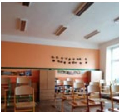
Třída v ZŠ po rekonstrukci

komise a velké poděkování patří opět nejenom jejich předsedkyním, ale zejména i členům těchto komisí. O své práci by vám však měly napsat v některém z dalších vydání zpravodaje spíše sami.