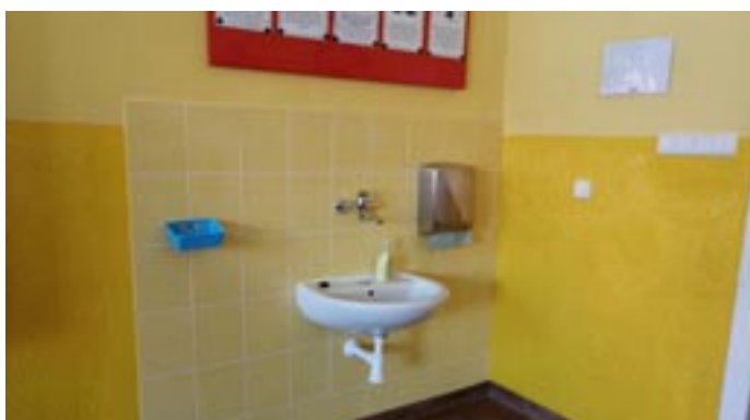
Rekonstrukce rozvodů vody v ZŠ

Myslíme také na kulturní a společenské vyžití. Podařilo se nám přivést do Újezda ZUŠ Pavla Křížkovského z Brna, a také Hudební školu Yamaha, která nabízí hudební vzdělávání pro děti od 6 měsíců. V loňském i letošním roce jsme připravili ve spo-