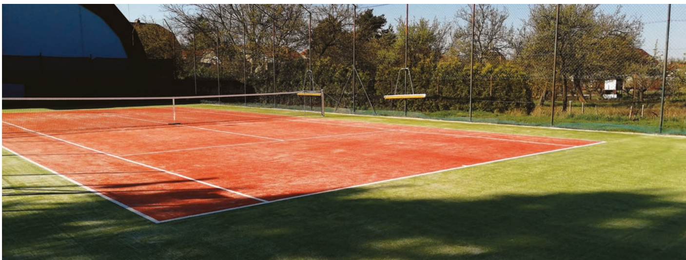
Hotový nový povrch