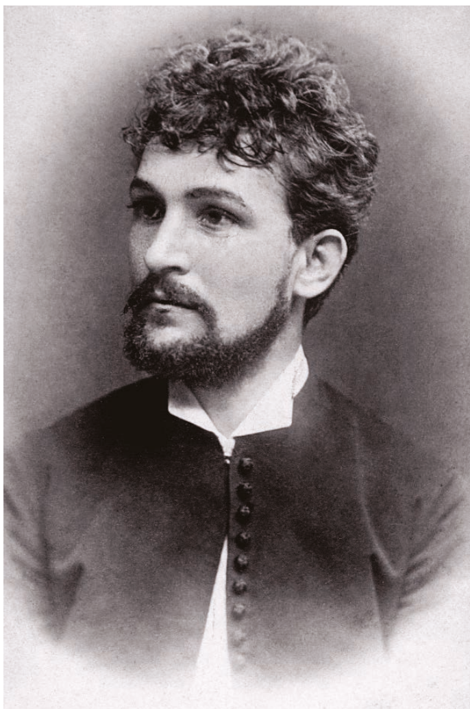
Leoš Janáček v roce 1882