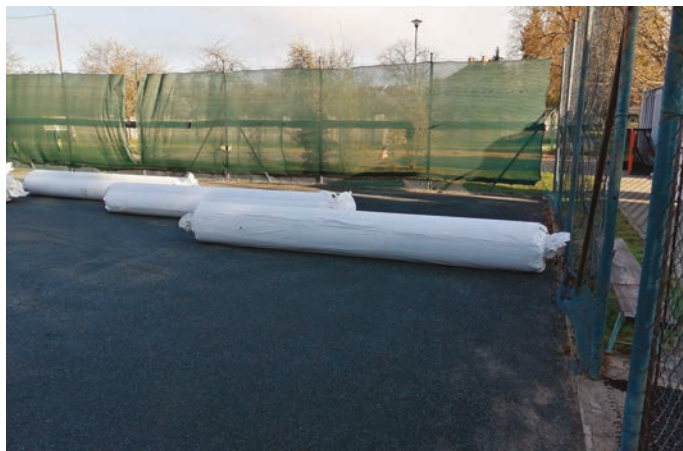
Nový povrch ještě v balení od výrobce