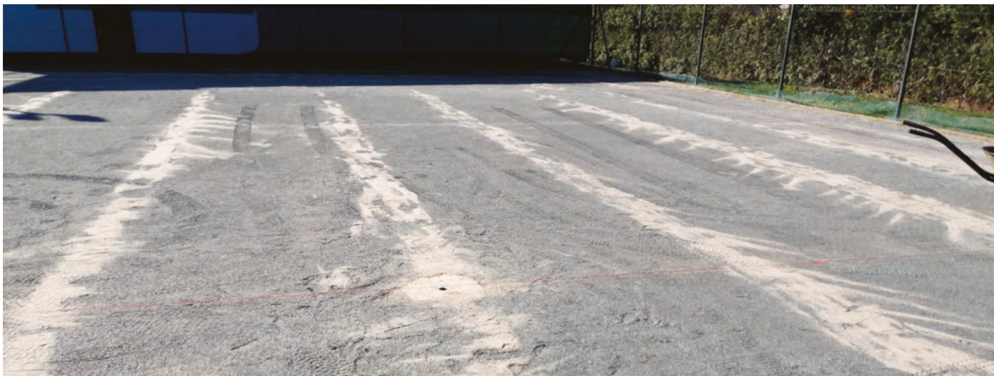
Po odstranění starého povrchu