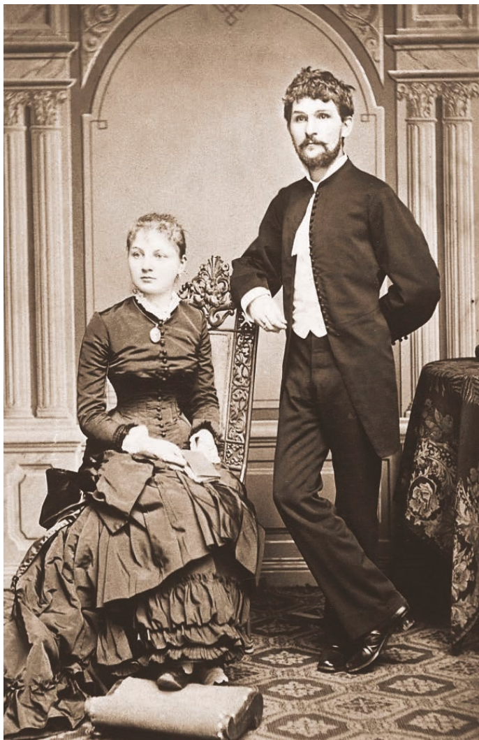
Leoš se snoubenkou Zdenkou v červnu 1881

Jméno vynikajícího hudebního skladatele Leoše Janáčka jistě znáte. Málokdo ovšem ví, že jeho osudy se lehce dotkly i našeho města. Do Újezda u Brna jezdil za tajemným léčitelem, který měl pomoci jeho nemocné dceři Olze. Někdy přijížděl s dcerkou, jindy takzvaně na radu zcela sám. A jak těžký byl život Leoše Janáčka? Pojďme si o něm chvilku povídat. A protože se říká, že za vším stojí žena, začneme jeho manželkou.