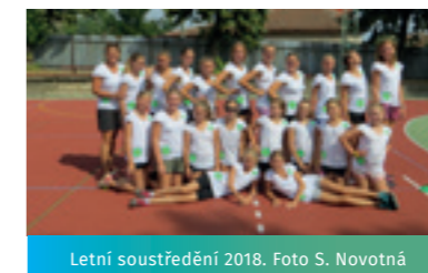
Letní soustředění 2018.

V soutěži Poháru 7. tříd se dívkám daří nejlépe ze všech družstev, aktuálně se probíjaly na krásné 8. místo v celém Jihomoravském kraji. Dne 19.1.2019 odehrály žákyně A 6. kolo v rámci svoji soutěže na domácí půdě v tělocvičně ZŠ Újezd u Brna, a sehrály nádherné zápasy