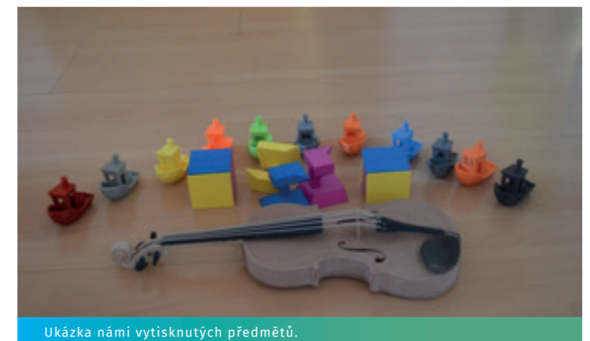
Ukázka námi vytisknutých předmětů.