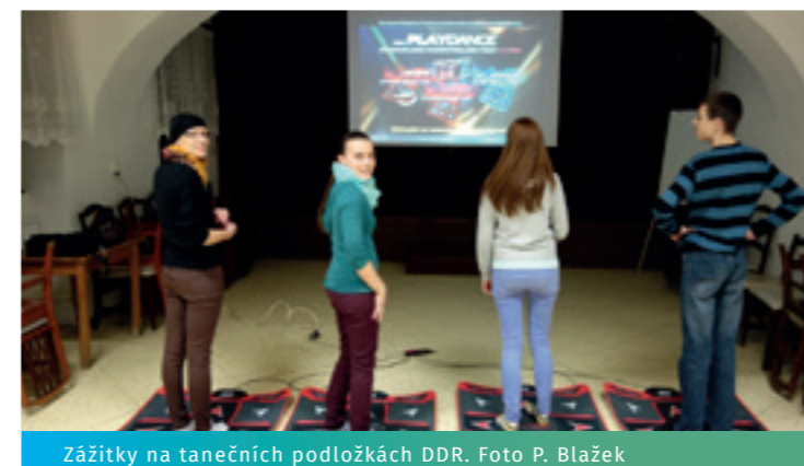
Zážitky na tanečních podložkách DDR.