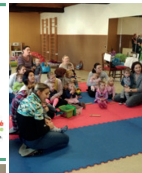
Mateřský klub OVEČKA