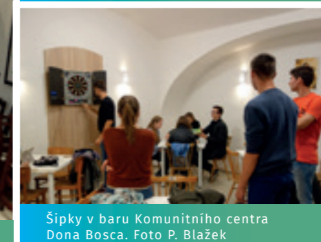
Šipky v baru Komunitního centra Dona Bosca.