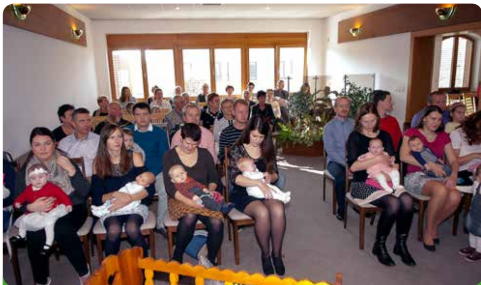
Na vítání bylo pozváno dvanáct dětí s rodinnými příslušníky