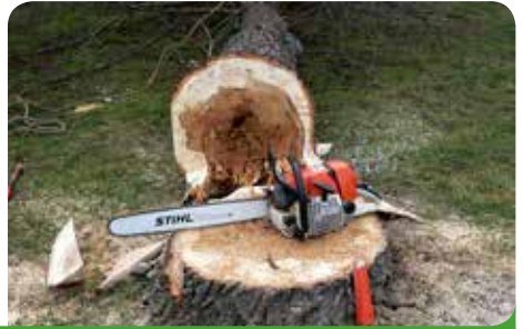
Kácení a odklizení stromů za součinnosti pracovní skupiny města

Na potvrzení našeho správného rozhodnutí jsme si museli několik let počkat. Orkán, který se v neděli 29. října 2017 prohnal naším územím, prokázal, že rekonstrukce parku byla zcela profesionální.