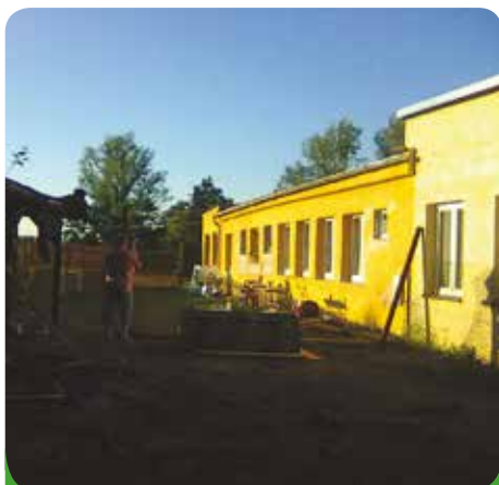
Sociální byty na ulici Štefánikova, bývalý areál MB Realu