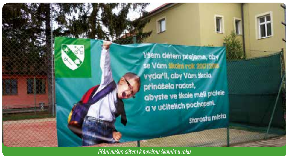
Přání našim dětem k novému školnímu roku