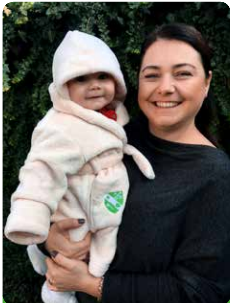
Děti dostávají od města župánky s městským znakem