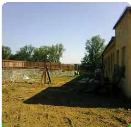
Plocha je připravena na započítí nadstavby sociálních bytů

Petr Suchý, vedoucí pracovní skupiny města