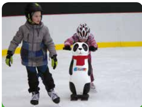
Bruslení si užívají hlavně děti