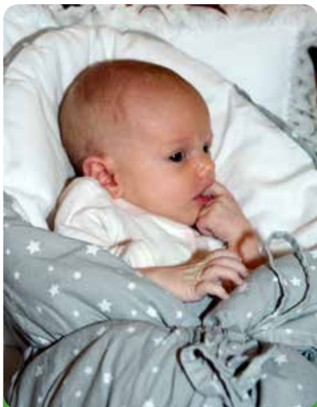
Jen malí občaní si svůj velký den zatím ani neuvědomují