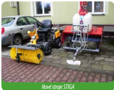
Nové stroje STIGA