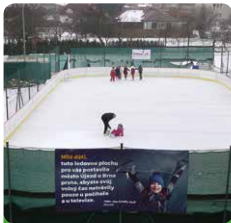
Nové kluziště v areálu základní školy

Ode dne otevření v průměru dochází na kluziště denně na veřejné bruslení 100 dětí a 50 dospělých, v době školního vyučování se tu pohybuje přibližně 200 dětí. Ve večerních hodinách, kdy si prostor mohou rezervovat skupiny, tu bývá běžně kolem 15 platících osob. To znamená, že kluziště za dobu jeho otevření navštívilo kolem 2 tisíc dětí a 1 tisíc dospělých osob v době veřejného bruslení a 2 tisíce dětí v době vyučování, kdy má kluziště k dispozici škola. Ve večerních hodinách ve skupinovém bruslení využilo kluziště 230 občanů. V součtu tedy za měsíc provozu navštívilo kluziště přes 5 tisíc lidí. Tuto informaci poskytli správce kluziště pan Tomáš Harvánek.