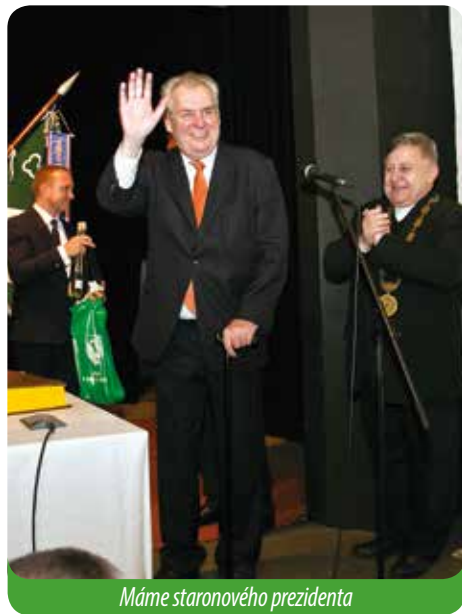
Máme staronového prezidenta