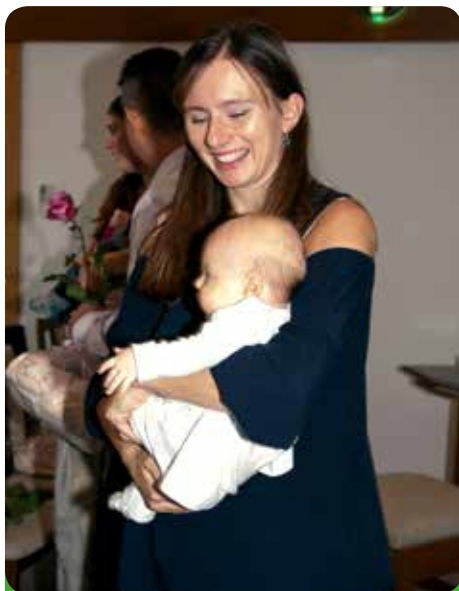
Pyšná maminka se svou právě přivítanou ratolestí