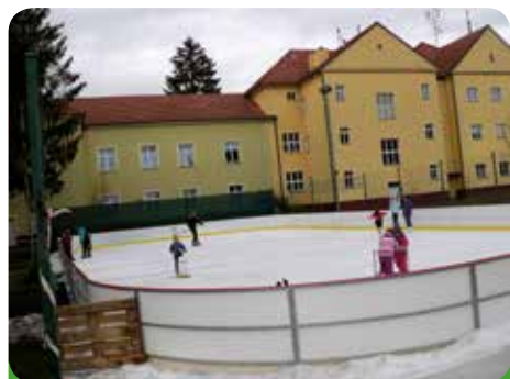
Kluziště vzniklo v místě jednoho z tenisových kurtů