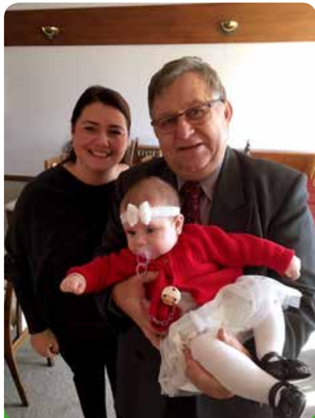
Takovou parádnici si rád pochová i pan starosta