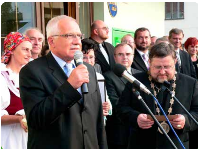
Prezident republiky Václav Klaus zdraví přítomné občany