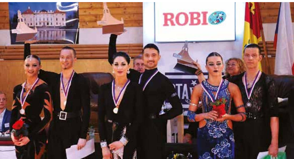
TANEČNÍ SOUTĚŽ SE KONALA V TĚLOCVIČNĚ ZŠ NA ZAČÁTKU LÉTA 2017