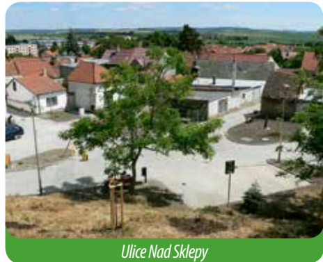
Ulice Nad Sklepy

Některé připomínky byly oprávněné, protože přece jen – víc hlav, víc ví. Ovšem některé připomínky byly k pousmání. Kupříkladu z lokality Nad Sklepy se ozvalo pár lidí, abychom snížili noční svícení, protože „neporostou ředkvičky“. Musím říct, že jsem na jednu stranu starost chápal, ale přece jenom jsme těmto požadavkům nepodlehli. Je pravdou, že některé