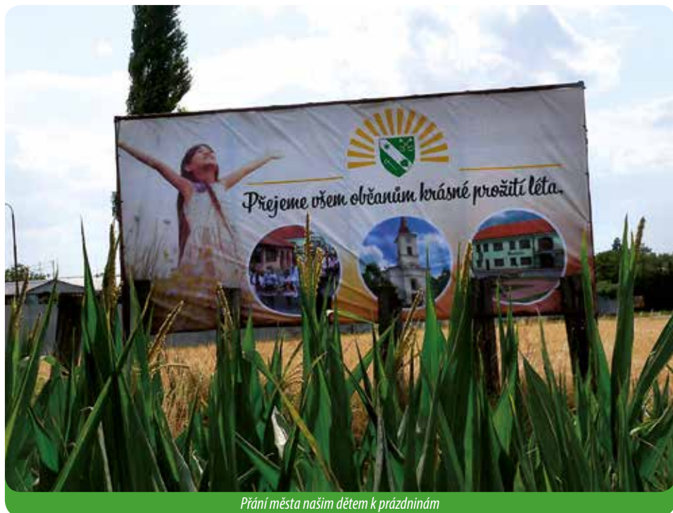
Přání města našim dětem k prázdninám