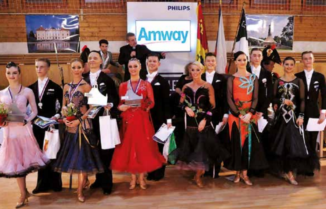
TANEČNÍ SOUTĚŽ GRAND PRIX AUSTERLITZ, VYHLÁŠENÍ VÝSLEDKŮ