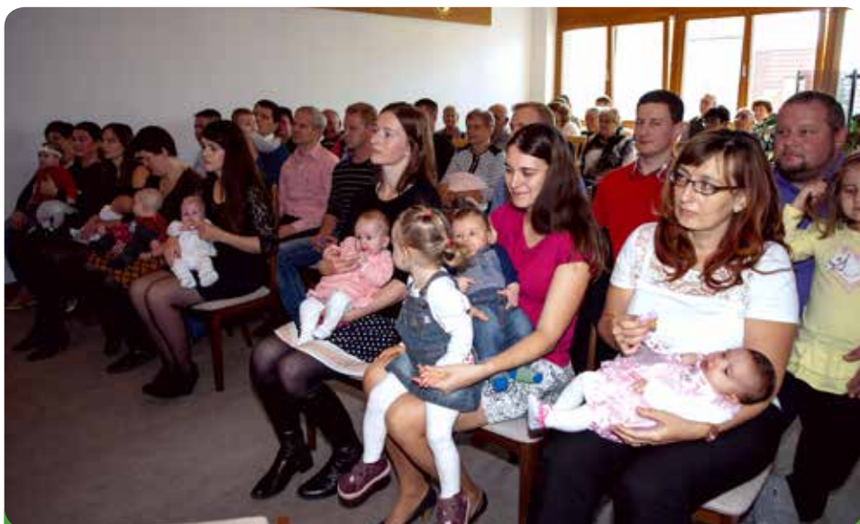
Na vítání občánků nejsou pozváni jen rodiče, ale i prarodiče a blízcí příbuzní. Tentokrát byla plná obřadní síň