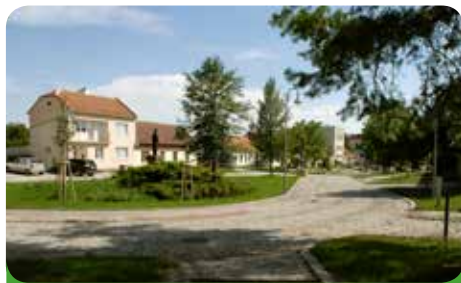
Náměstí sv. Jana

požadavky byly ryze sobecké, kdy lidé vlastně byli schopni omezovat svoje sousedy.