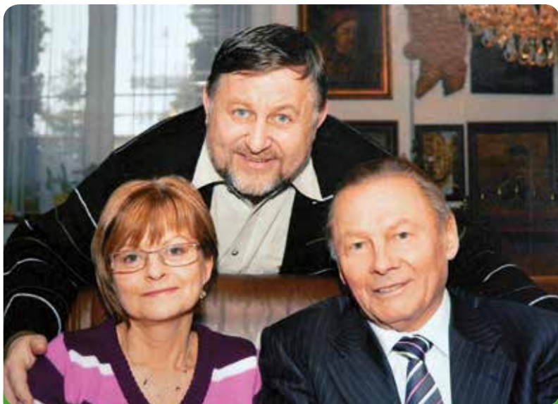
Osobní foto starosty s prezidentem Slovenské republiky Rudolfem Schusterem v Újezdě u Brna