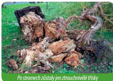
Po stromech zůstaly jen ztrouchnivělé třísky

Park jsme zrekonstruovali, vysadili nové stromy. A ti starostliví zastupitelé, kteří věc tenkrát oznámili a poslali na úřad kontrolu ze životního prostředí, se do dnešního dne neomluvili . . . no, o co jde . . .