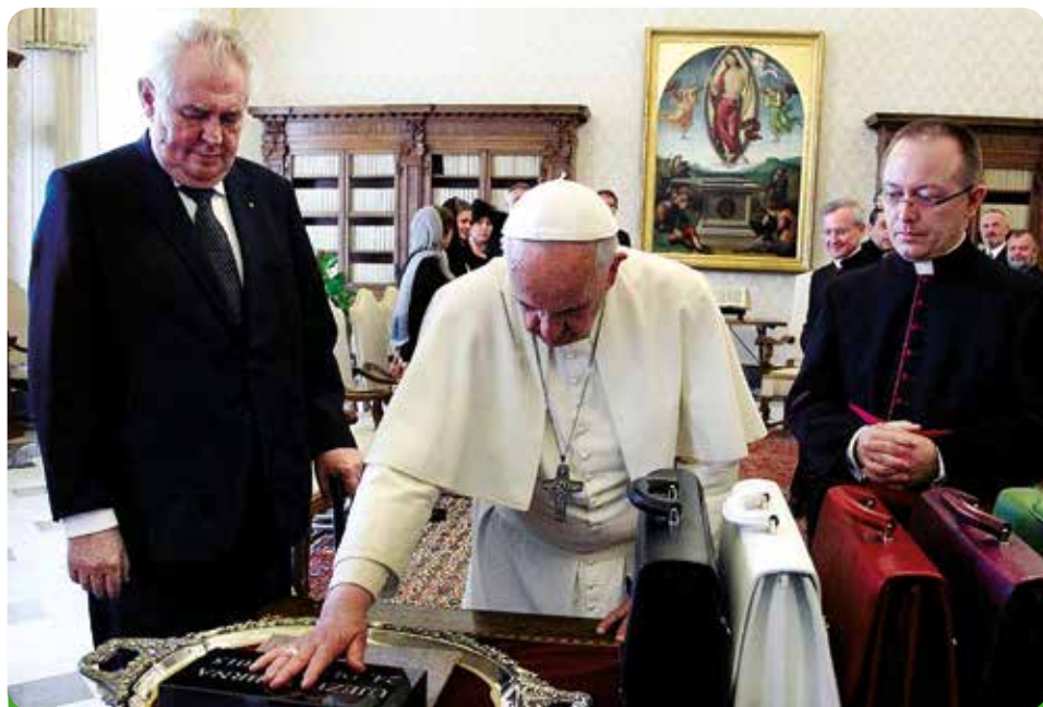
Požehnání základního kamene nového domova pro seniory