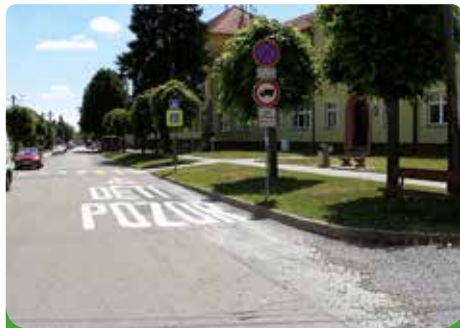
Přechod pro chodce

pohyb dětí. Tento typ starosti města o bezpečnost je nutný, obzvláště dnes, kdy doprava hrubě přesahuje možnosti komunikací.