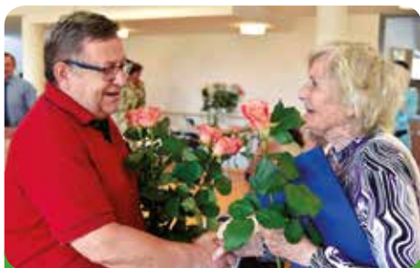
Starosta města gratuluje absolventce kurzu

Kurz bude ukončen slavnostním předáváním osvědčení o studiu, na které budou pozváni rodinní příslušníci a blízcí studentů-seniorů a představitelé města Újezd u Brna, které se na tomto projektu, vedle Jihomoravského kraje, aktivně podílí.