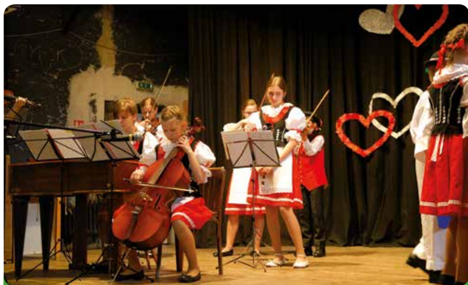
Den matek – vystoupení