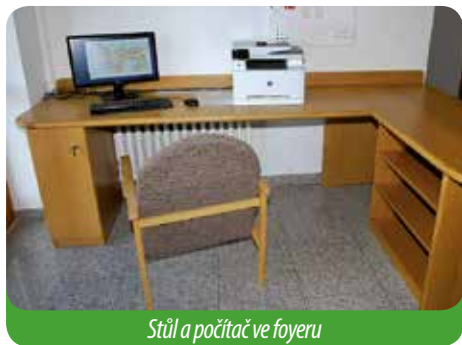
Stůl a počítač ve foyeru