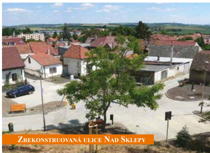
ZREKONSTRUOVANÁ ULICE NAD SKLEPY