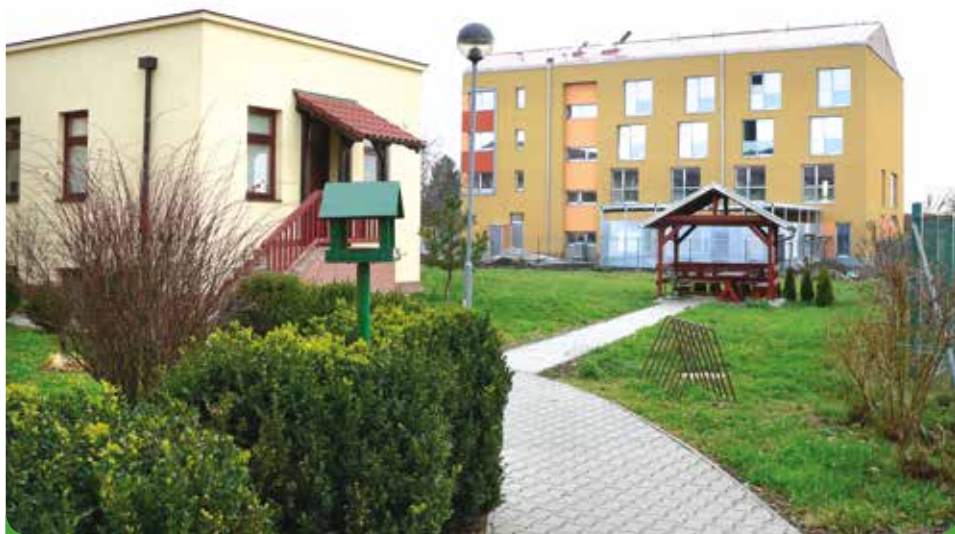
Nový Domov pro seniory, kdy město poskytlo JMK pozemek