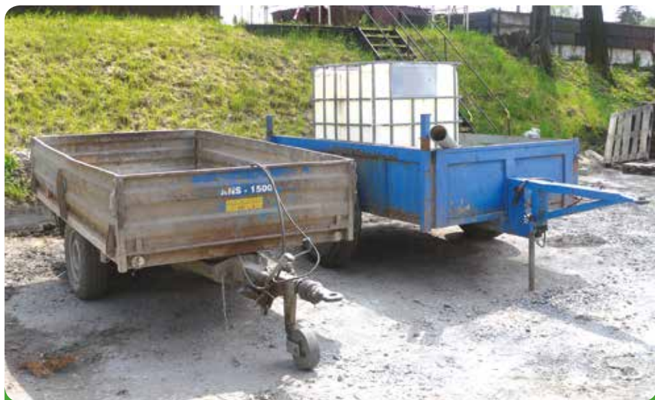
Jednonápravové vlečky za traktory, 81.600,- Kč