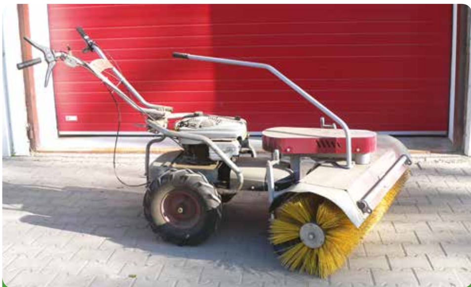
Dakr Panter – zametač, 37.730,- Kč + 3 ks náhradní kartáčů á 21.990,- Kč