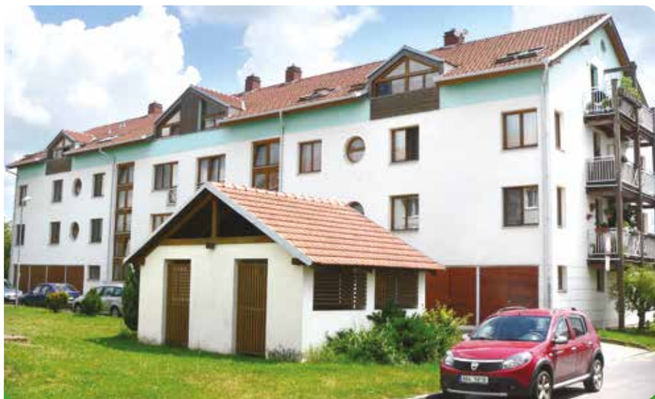
Naše bytové domy