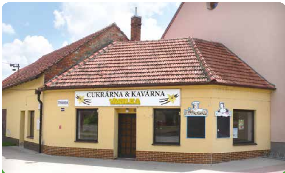
Cukrárna, která čeká na rekonstrukci, 1.410.172,61 Kč