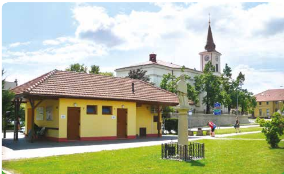
Zastávka u Radnice s veřejnými toaletami a prodejníčkou, 1.052.740,90 Kč, hrazeno městem