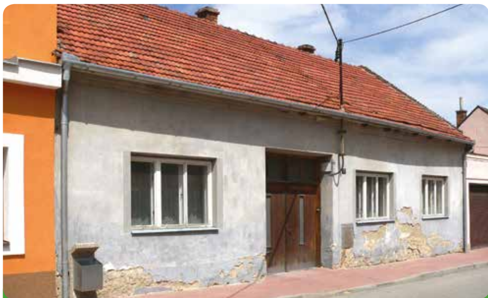
Zakoupeno městem pro budoucí jesle, popř. stavební úřad.