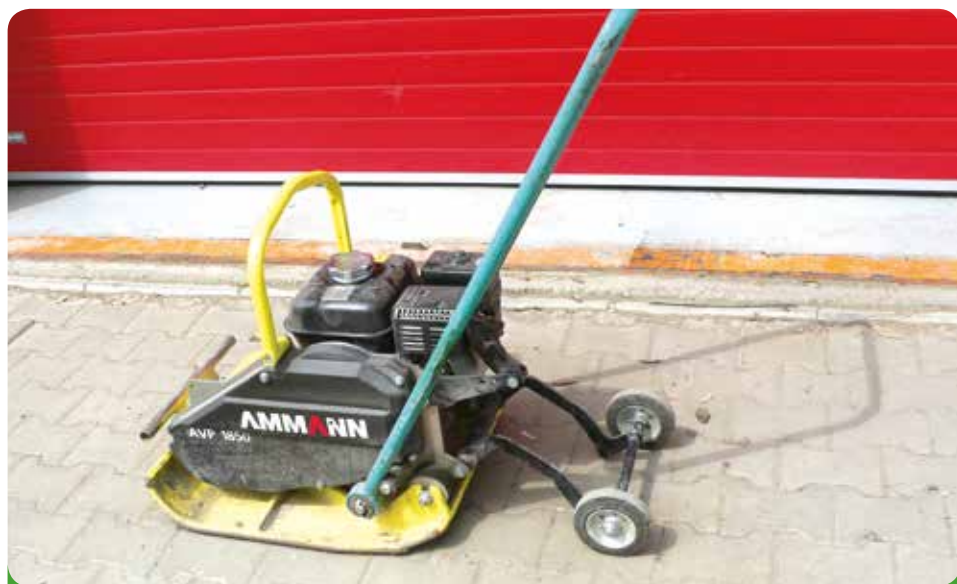
Vibrační deska Ammann, 52.800,- Kč