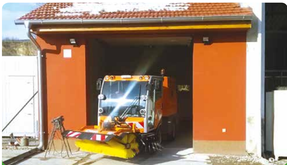
Nová vyhříváná garáž 1.061.7345,05 Kč, pro nové zametací auto City Cat 3.461.459,60 Kč, dotace ze SFŽP 2.924.100,- Kč, zbytek hrazen městem