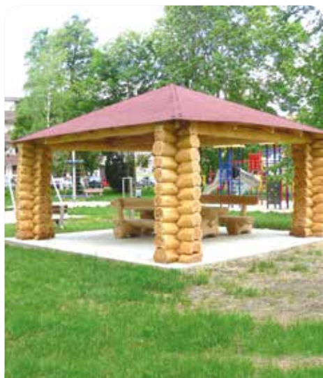
Nová pergola v parku, vedle nového dětského hřiště pro maminky s dětmi