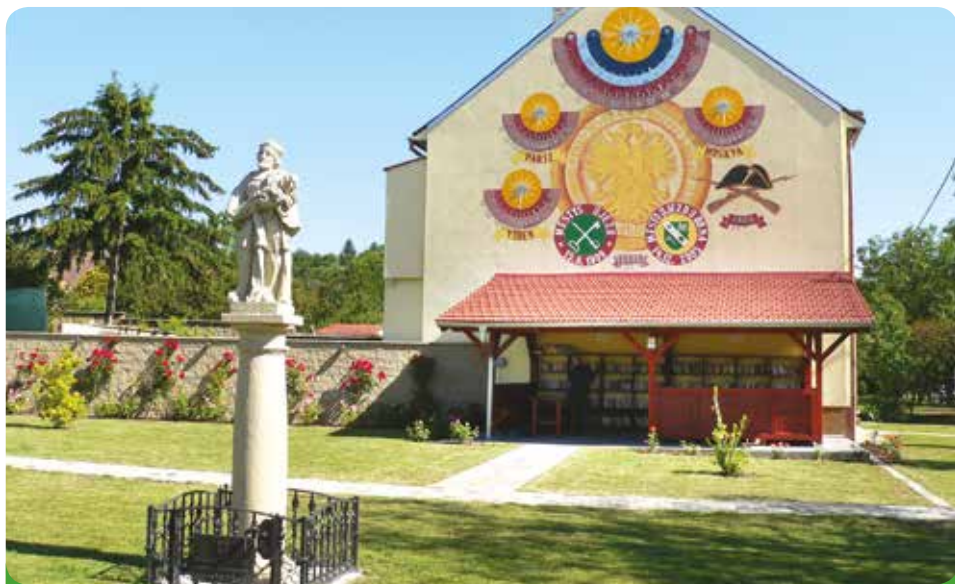
Venkovní knihovna pro veřejnost, 333.089,- Kč, hrazeno městem