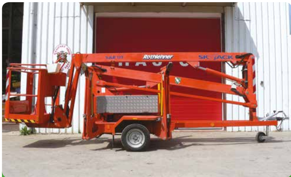
Montážní plošina Sky Jack 12 m, 359.975,- Kč, hrazeno městem