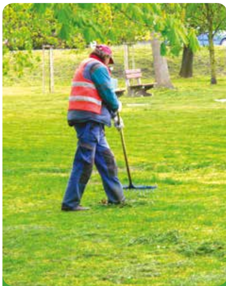
Hrabání posečené trávy