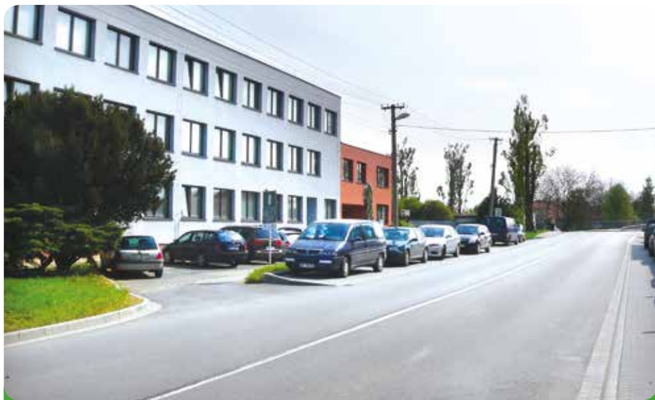
Parkoviště u Elserema, zbudované na náklady firmy