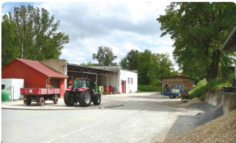
Zázemí naší pracovní skupiny včetně nového traktoru, cena celého areálu dosažená vydražením 5.400.000,- Kč