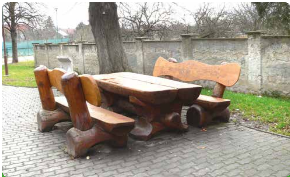
Sezení na starém hřbitově, které vydrželo již léta volné tvořivosti mládeže