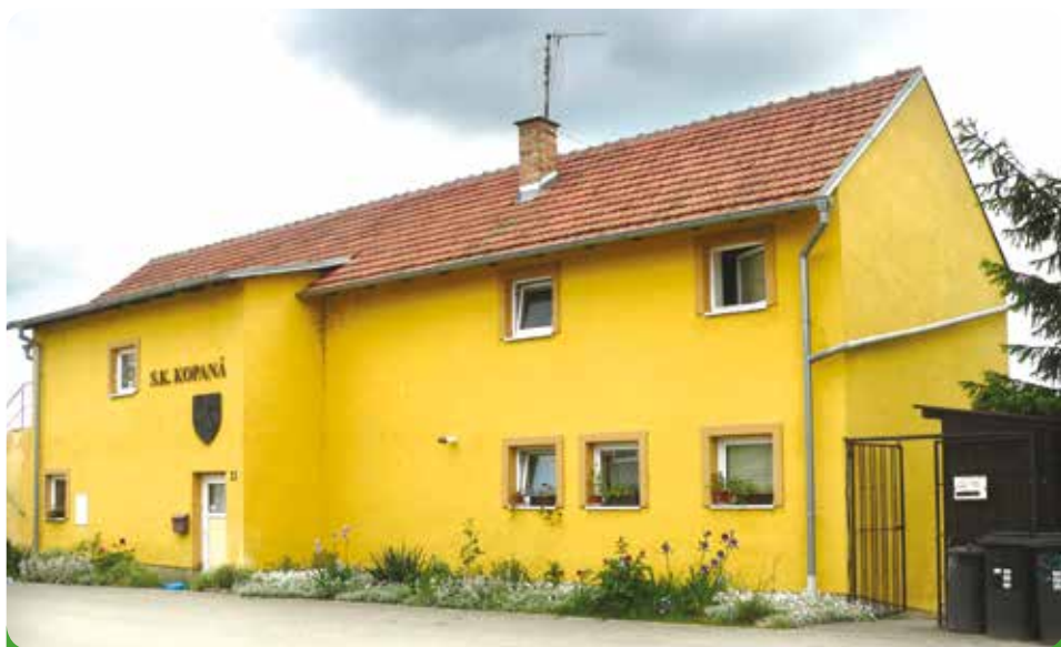
Ubytovna na fotbalovém hřišti před generální rekonstrukcí, 861.317,40 Kč