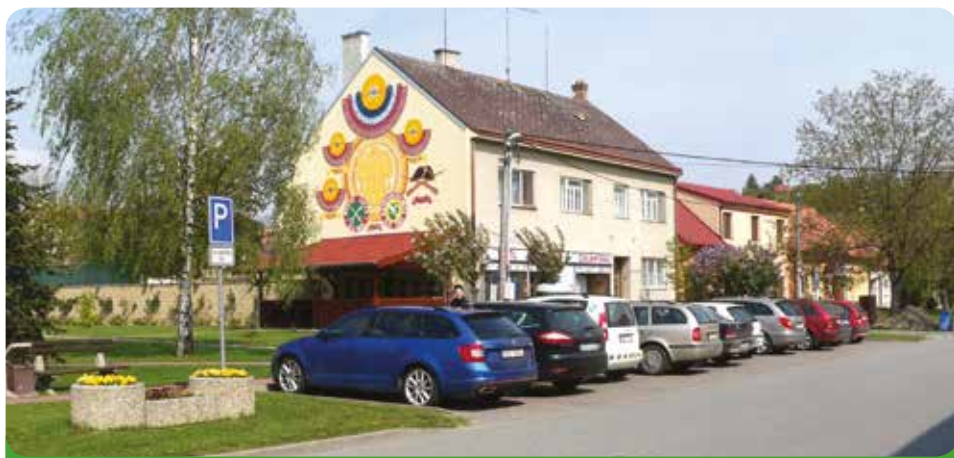
Parkoviště před Radnicí, 599.815,90 Kč i s vozovkou, hrazeno městem

Za parkování ve středu města se nebude alespoň v tomto volebním období parkovné vybírat.