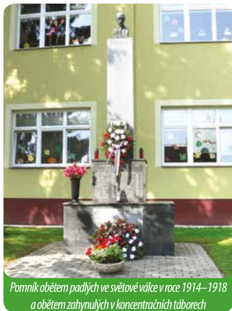
Pomník obětem padlých ve světové válce v roce 1914–1918 a obětem zahynulých v koncentračních táborech