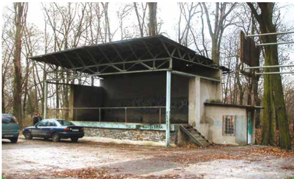
Bývalá tribuna v parku, z které jsme zbudovali Klubovnu pro mládež