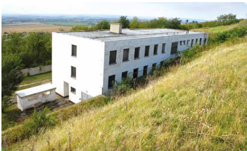
Bývalý vojenský areál v majetku města, převedeno bezúplatně