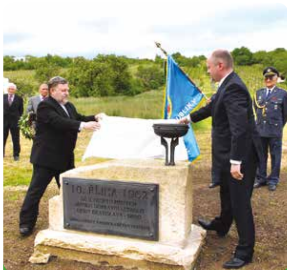
Památník lidem, kteří zahynuli při havárii letadla, které se zřítilo na Staré hoře dne 10. 10. 1962