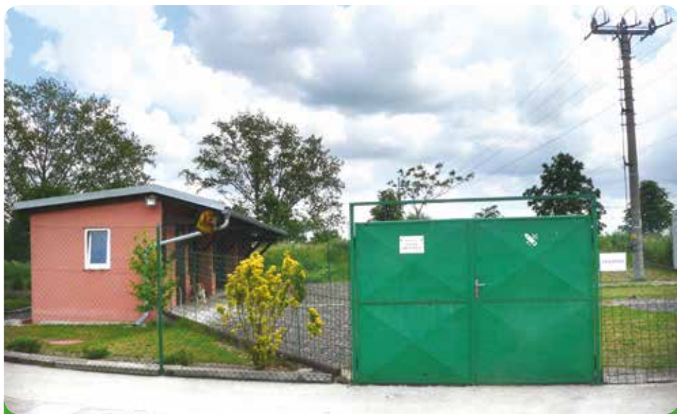
Útulek pro zatoulaná zvířata