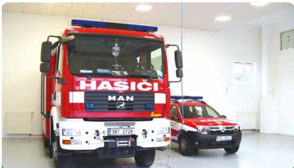
Hasičská auta - Man, 5.716.243,- Kč, dotace z Ministerstva vnitra 3.000.000,- Kč - Dacia Duster 4 x 4 420.000,- Kč, dotace JMK 150.000,- Kč, zbytek hrazen městem