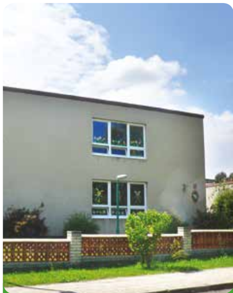
Budova mateřské školy, 5.522.850,- Kč