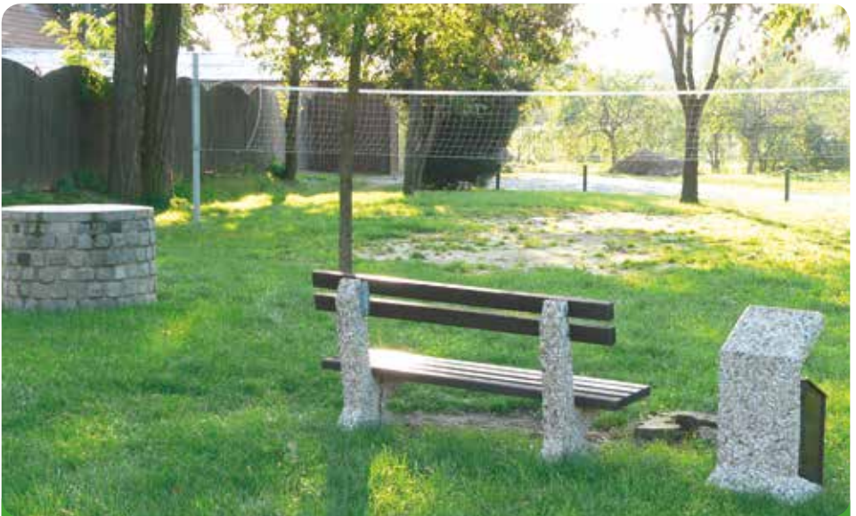
Hřiště na volejbal na Rychmanově – velice málo užívané k naší škodě