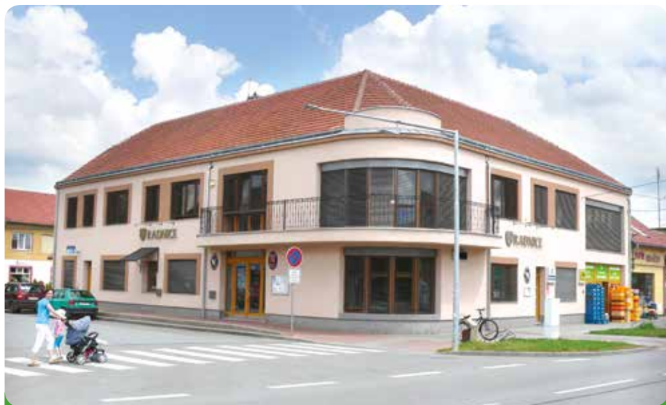
Radnice, 10.012.198,84 Kč, dotace ze SFŽP 2.527.41,- Kč, zbytek hrazen městem