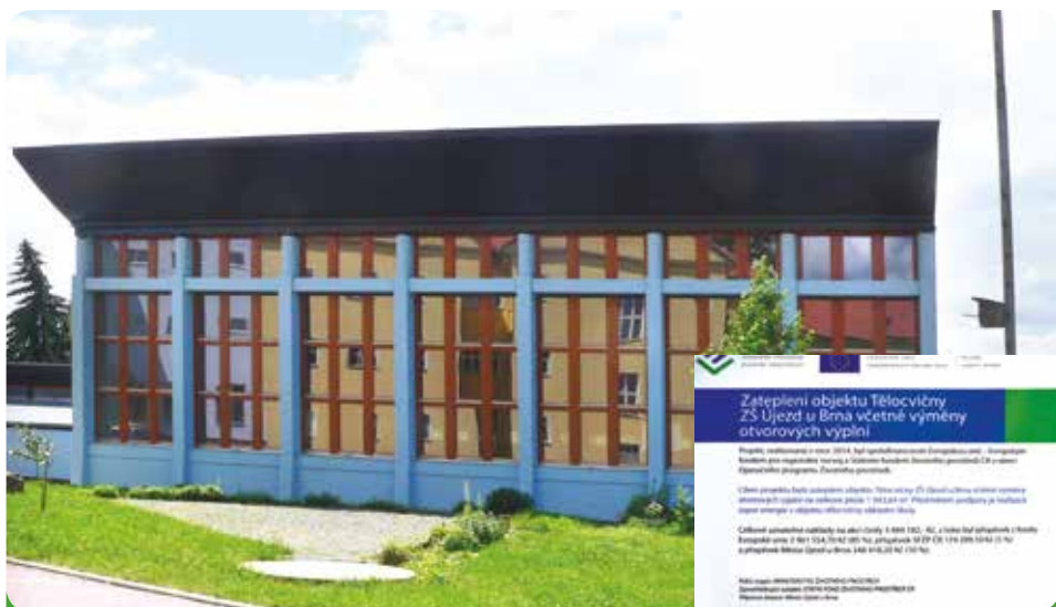
Nově zrekonstruovaná tělocvična – pohled z dvorního traktu ZŠ. Výměna oken s elektrickým otevíráním, zateplení pláště – odstranění zavlhání, 25.369.722,20 Kč