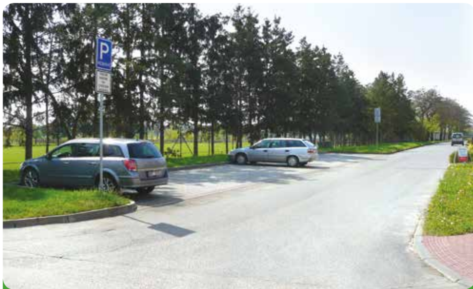
Parkoviště u hřiště, zbudované na pozemku města