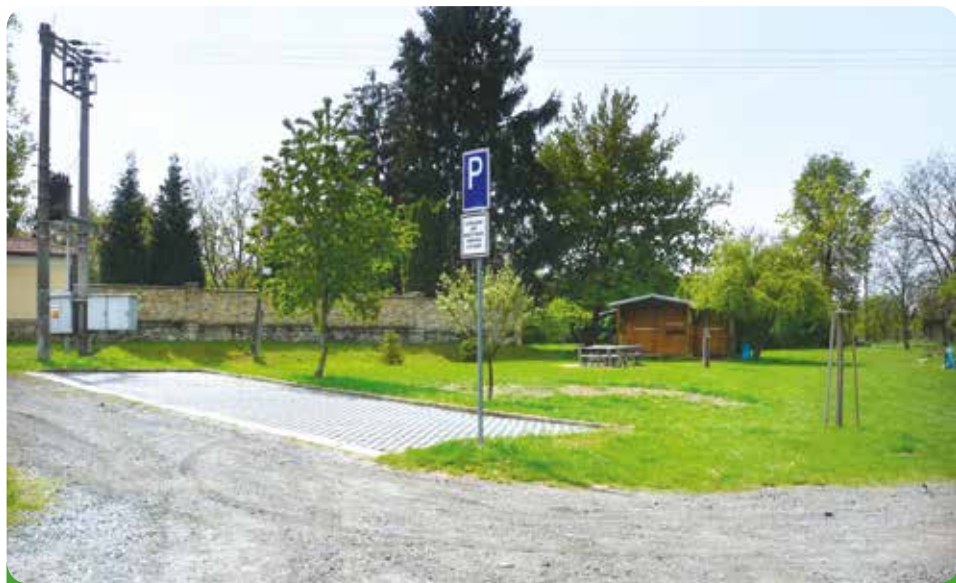
Parkoviště u evangelického hřbitova, hrazeno městem