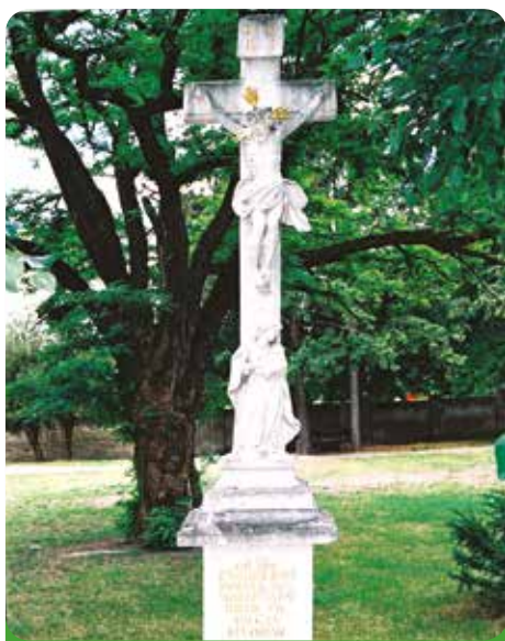
Kříž na starém hřbitově