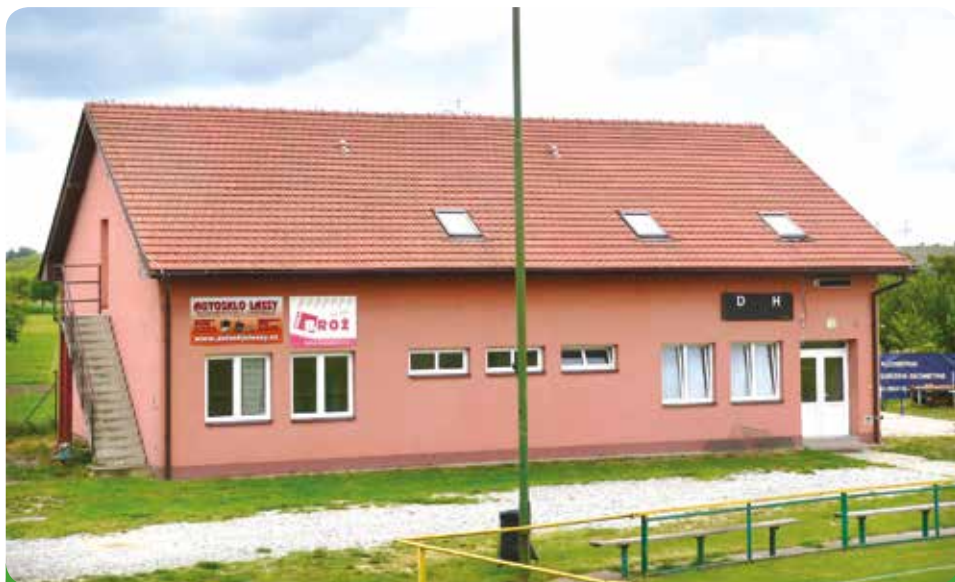
Nové šatny a fitness na fotbalovém hřišti, 6.326.703,40 Kč, dotace z JMK 4.187.000,- Kč, zbytek hrazen městem