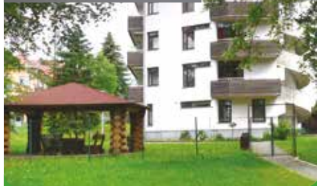
Penzion v nově zrekonstruovaném parku, 1.868.590,84 Kč, dotace ze SFŽP 633.913,- Kč, zbytek hrazeno městem