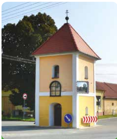
Kaple Cyrila a Metoděje na Rychmanově - čerstvě opravena