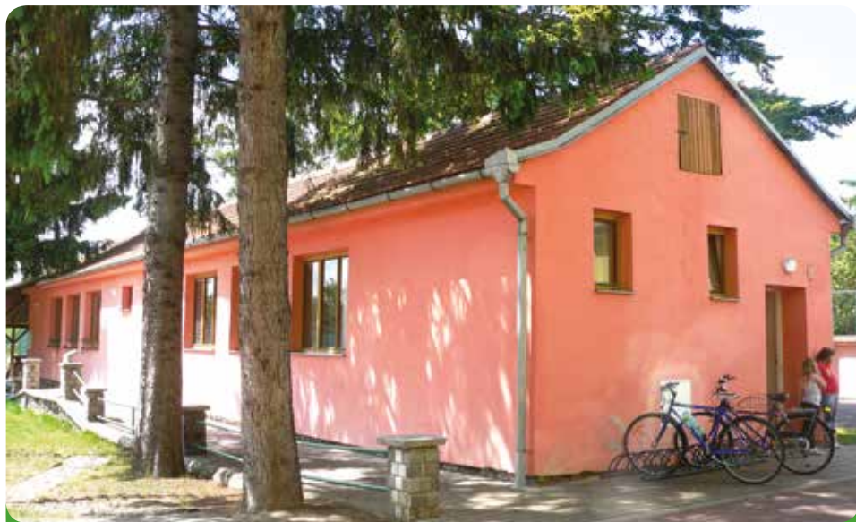
Klub odložených mužů a jedna nově zbudovaná třída