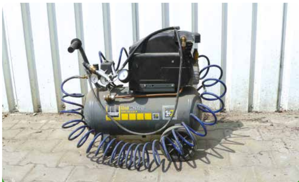
Elektrický kompresor Unimaster, 7.760,- Kč