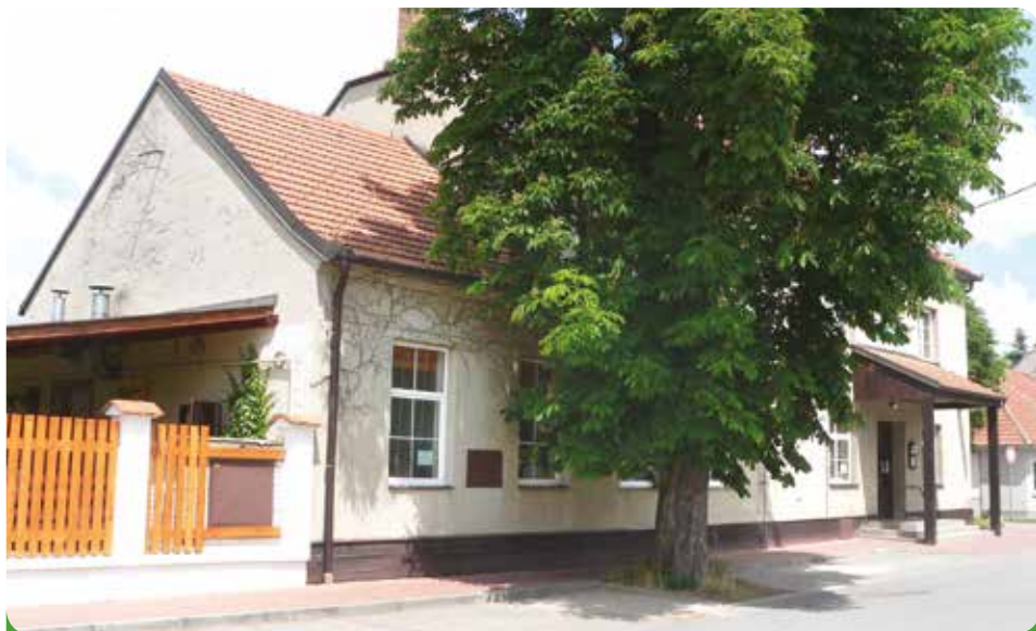
Rychta – restaurace, divadelní sál – průběžné opravy, 5.372.371,30 Kč, hrazeno městem