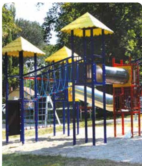
Nové dětské hřiště v parku pro maminky s dětmi, 861.135,71 Kč, hrazeno městem