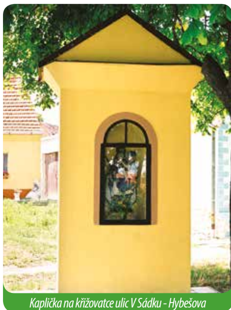
Kaplička na křižovatce ulic V Sádku - Hybešova