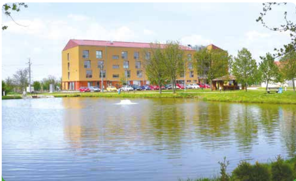
Parkoviště u Domova pro seniory, investor JMK