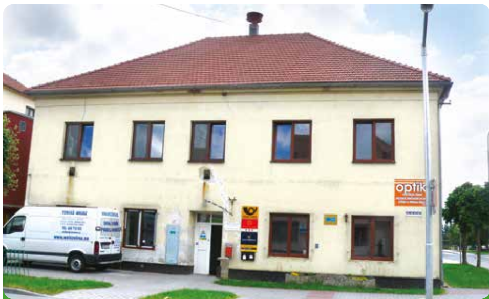
Pošta – probíhající výměna oken, oprava schodiště, zbudování dětské ordinace – klimatizace, 1.720.882,82 Kč