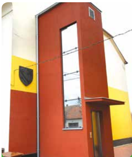
Výtah u zdravotního střediska 1.815.922,- Kč, hrazeno městem