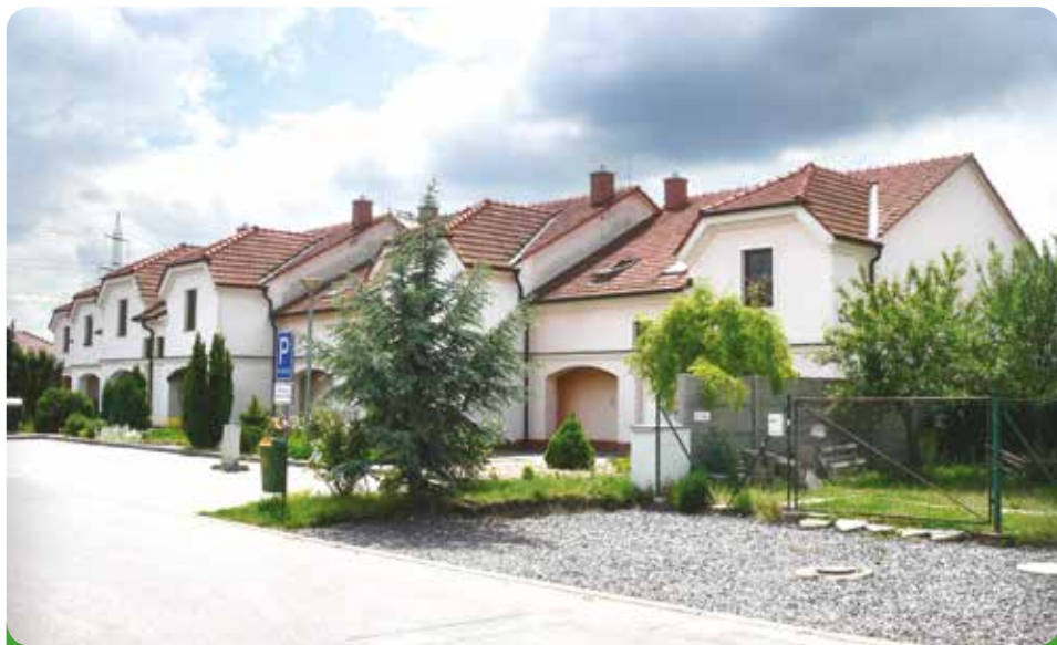
Naše bytové domy