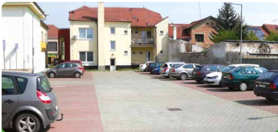
Parkoviště za zdravotním střediskem, 1.582.859,- Kč, hrazeno městem