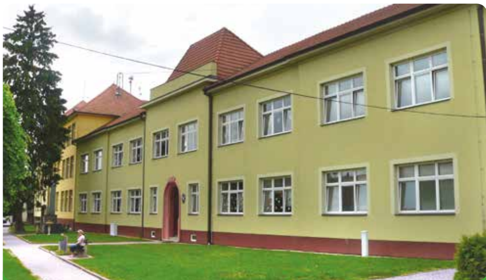
Základní škola po generální stavební rekonstrukci – střecha, zateplení pláště, okna, nová kotelná. Je připraven projekt na kompletní rekonstrukci elektrických rozvodů a zbudování kvalitní jazykové třídy, 30.813.330,50 Kč