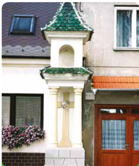
Kaplička na ulici Nádražní - dnes už navíc čerstvě zrekonstruovaná