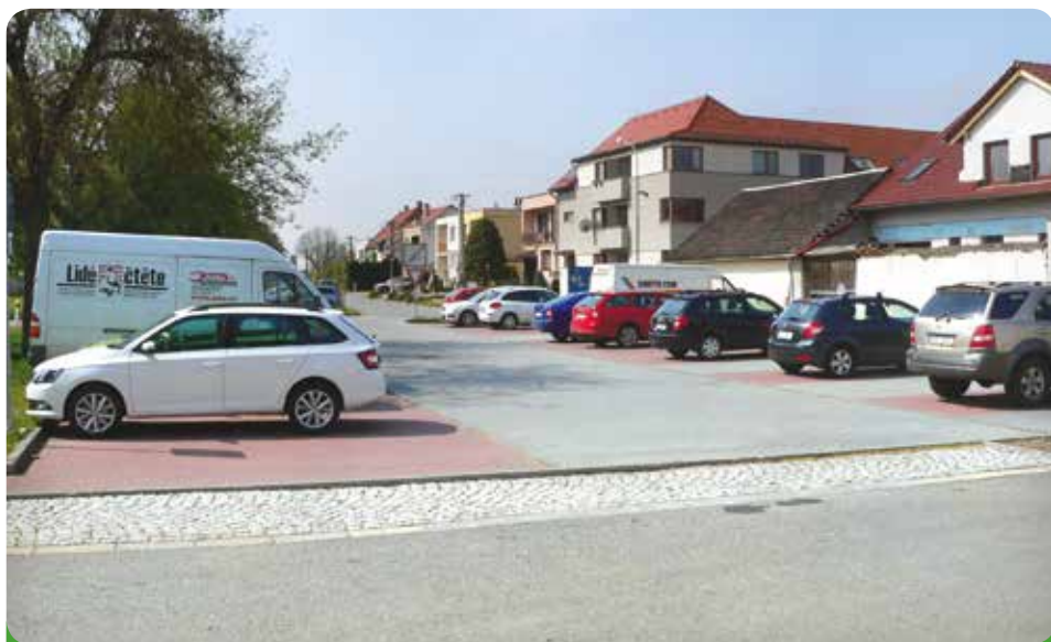
Parkoviště za Thermotechnikou, 1.305.669,32 Kč, hrazeno městem