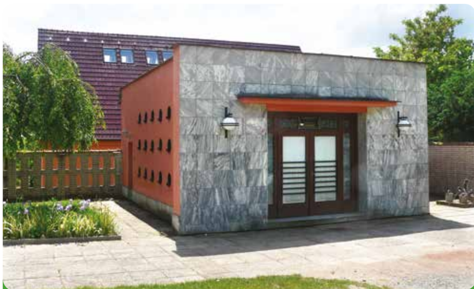
Márnice na hřbitově před kompletní technologickou rekonstrukcí, 385.746,- Kč, hrazeno městem