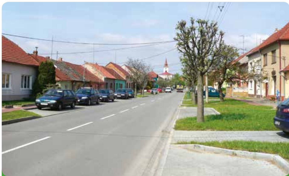
Zálivy na ulici Komenského, 1.673.196,46 Kč, hrazeno městem