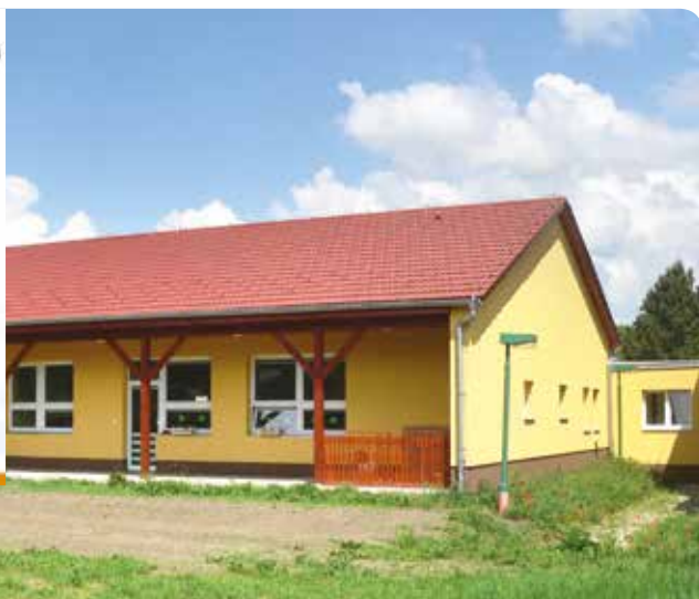
Náše školka má nový celý pavilon, prokazatelně je naplněna, i když někteří tvrdili, že je to zbytečné, 4.812.536,85 Kč, dotace z ROP JHV 3. 561.844,46 Kč, zbytek hrazen městem