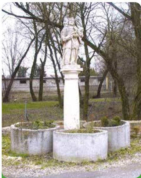
Sv. Jan na původním místě