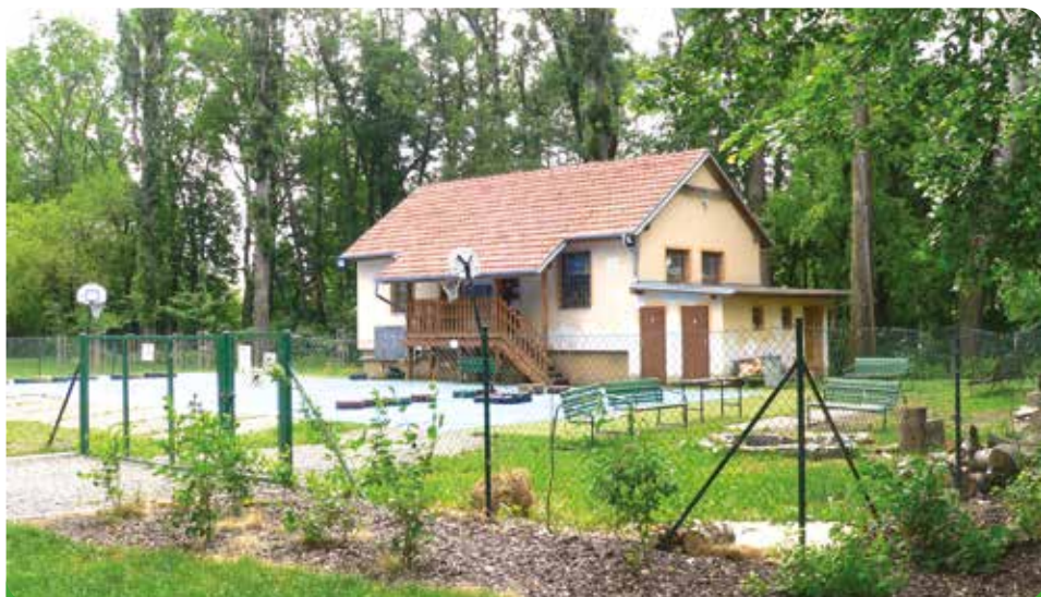
Klubovna pro mládež zbudovaná z tribuny včetně nového dětského hřiště, 1.463.326,- Kč, plocha před klubovnou 237.320,- Kč, zbytek hrazen městem