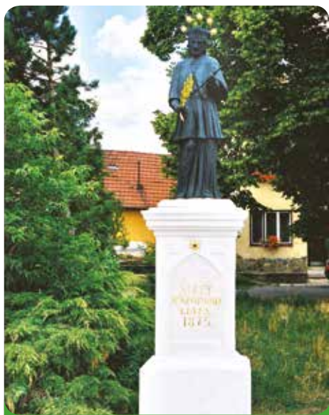
Sv. Jan po restaurování