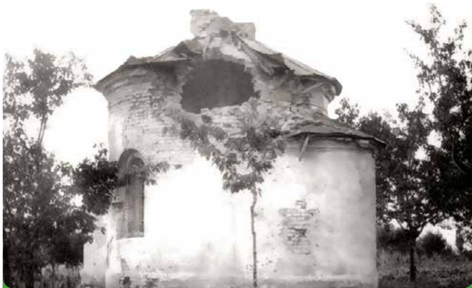
Kaple sv. Antonína po zásahu dne 23. 4. 1945