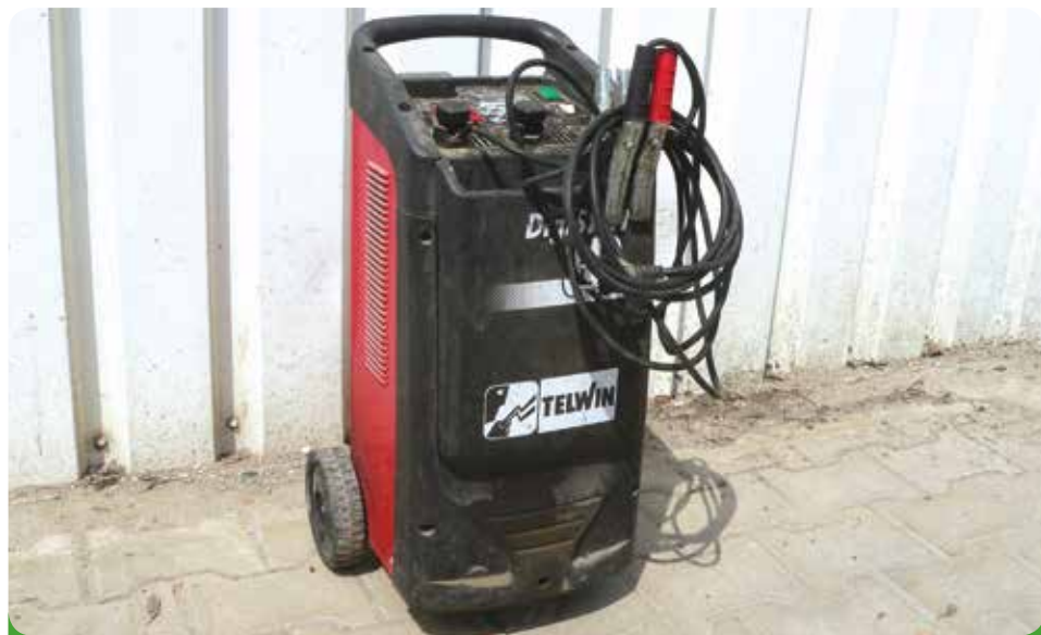
Elektrická nabíječka + startovací vozík Telwin, 7.130,- Kč