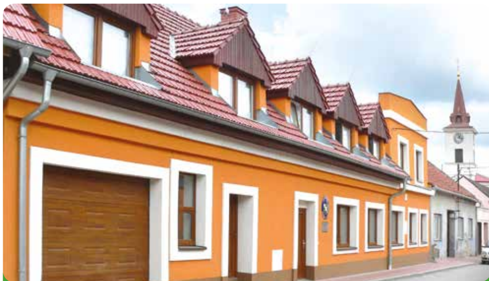
Knihovna – zakoupená, zbudováno na veřejnou knihovnu a 4 byty, 9.357.417,72 Kč, dotace na knihovnu od JMK 45.000,- Kč, zbytek hrazen městem