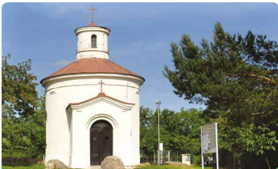
Kaple sv. Antonína Paduánského, majetek Římskokatolické církve, město ji na své náklady generálně opravilo