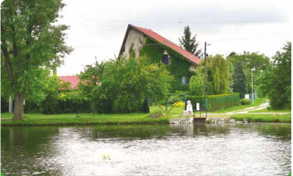
Náš rybník na Rychmanově včetně vodníka Tonika