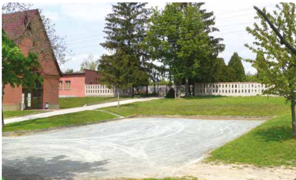
Parkoviště u obřadní síně - před rekonstrukcí