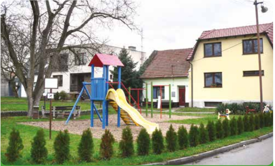
Dětské hřiště na Rychmanově, 113.949,50 Kč, hrazeno městem