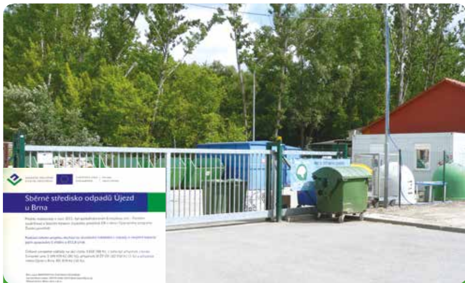
Nový sběrný dvůr, 4.303.946,70 Kč, dotace ze SFŽP 3.292.907,04 Kč, zbytek hrazen městem