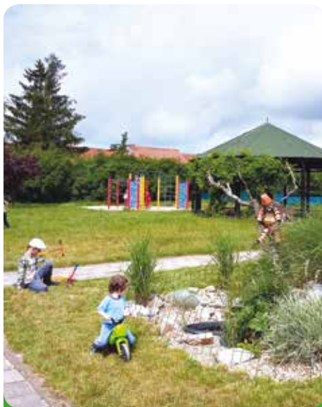
Zahrada v mateřské škole