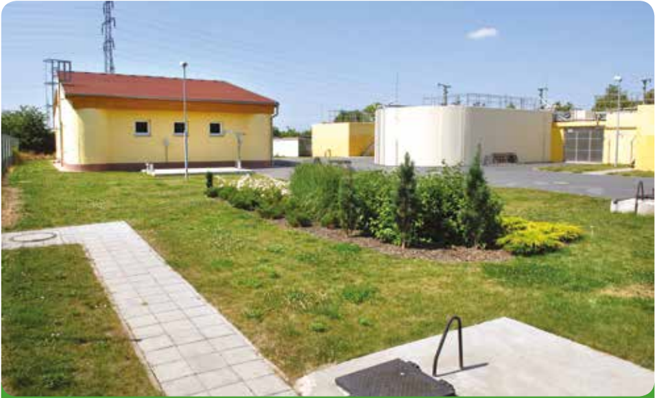
Naše zrekonstruovaná čistička odpadních vod na Šternově