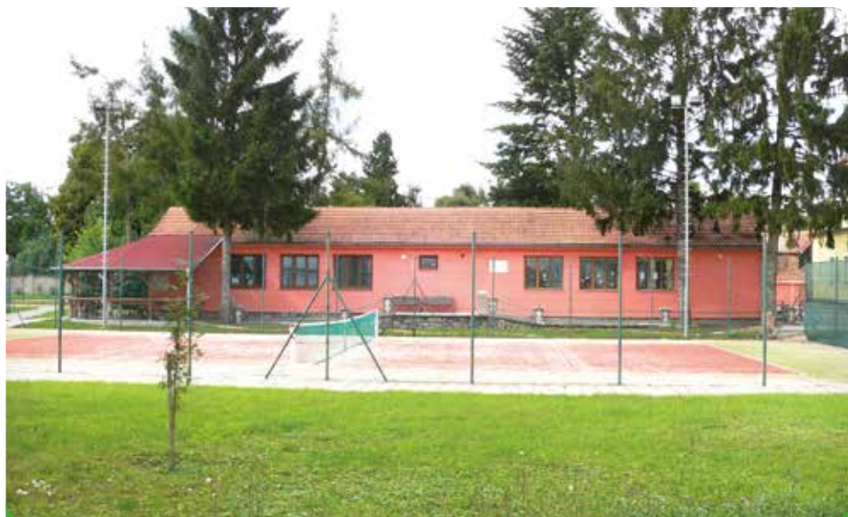
Naše tenisové kurty v areálu ZŠ včetně Klubu odložených mužů