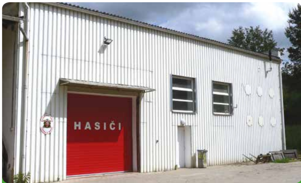
Náše hasička s novými dveřmi a elektronickými vraty – plně vybavená včetně klubu hasičů