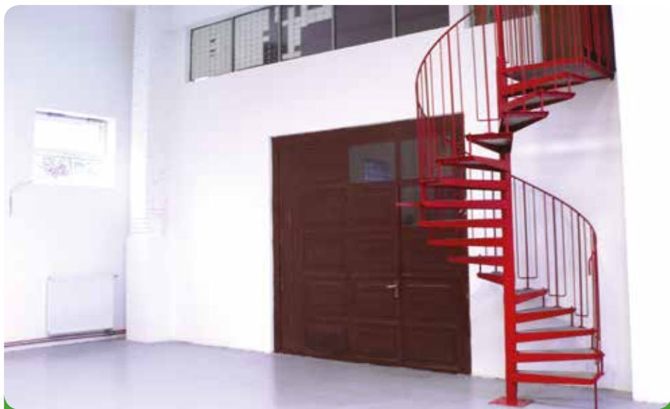
Hasičská zbrojnice, 1.747.266,16 Kč, hrazeno městem