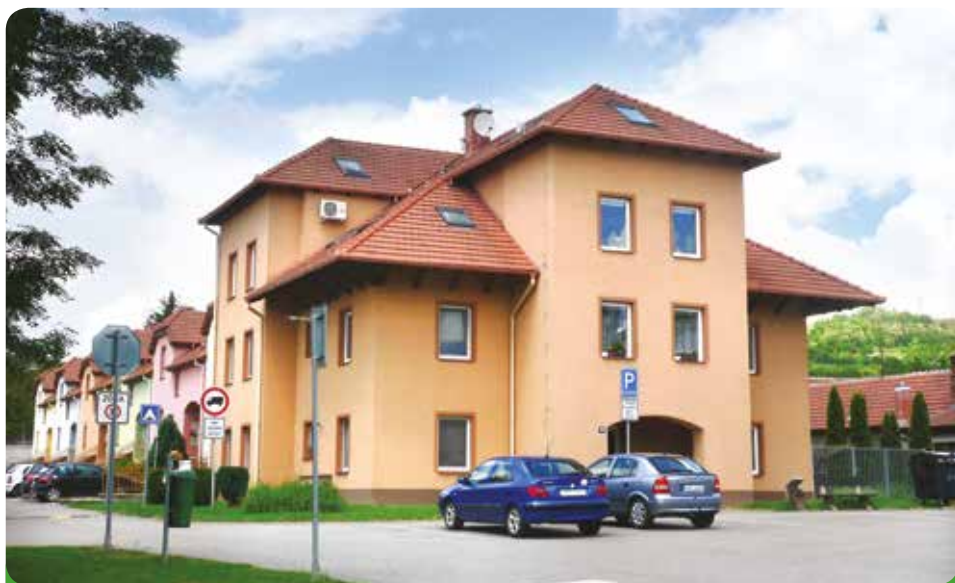
32 bytových družstevních jednotek