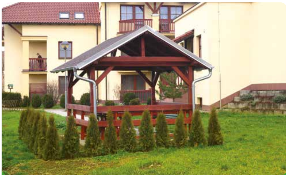
Nový altánek pro naše seniory u Domu s pečovatelskou službou