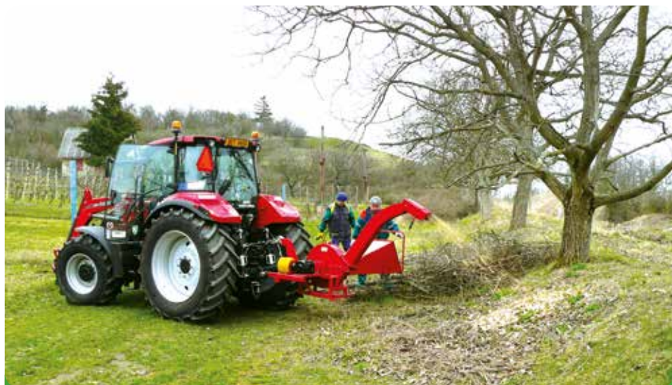
Nový traktor Case + štěpkovač větví + mobilní kompostárna s kompostováním ve vacích, 6.569.317,- Kč, dotace z Ministerstva životního prostředí 5.649.801,30 Kč, zbytek hrazen městem