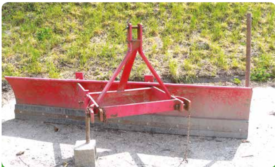
Sněžná radlice, 4.930,- Kč