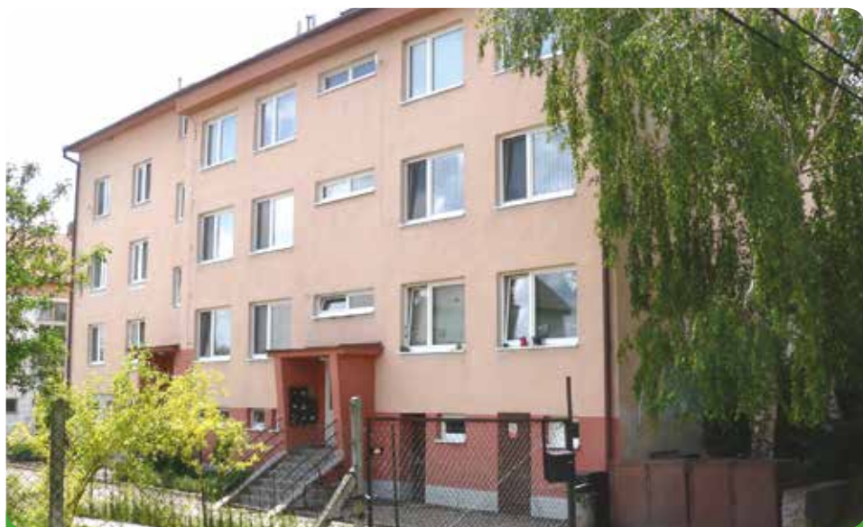
Naše bytové domy