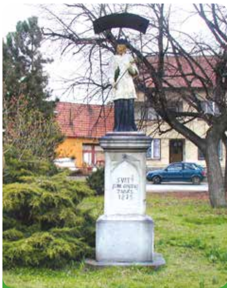
Sv. Jan na náměstí