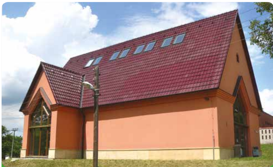
Nová obřadní síň, 9.397.594,13 Kč, hrazeno městem