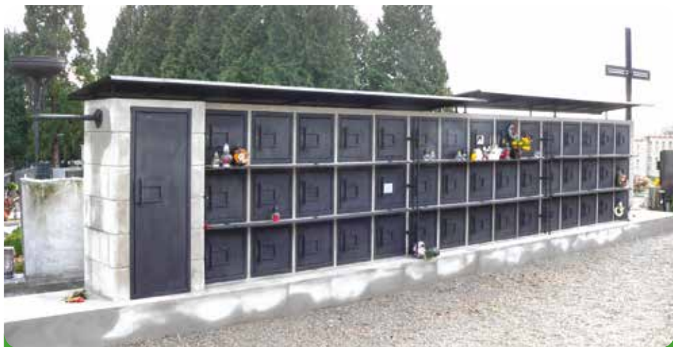
Nové kolumbárium na hřbitově, 261.937.54 Kč, hrazeno městem