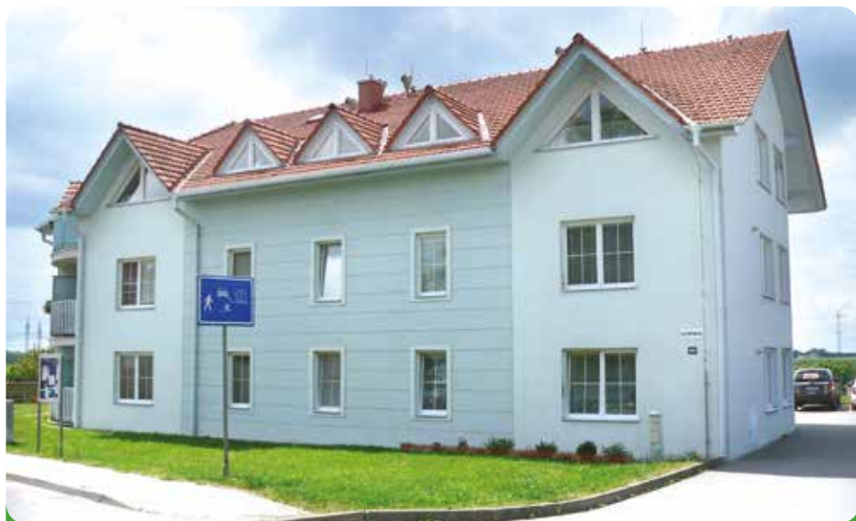
Naše bytové domy