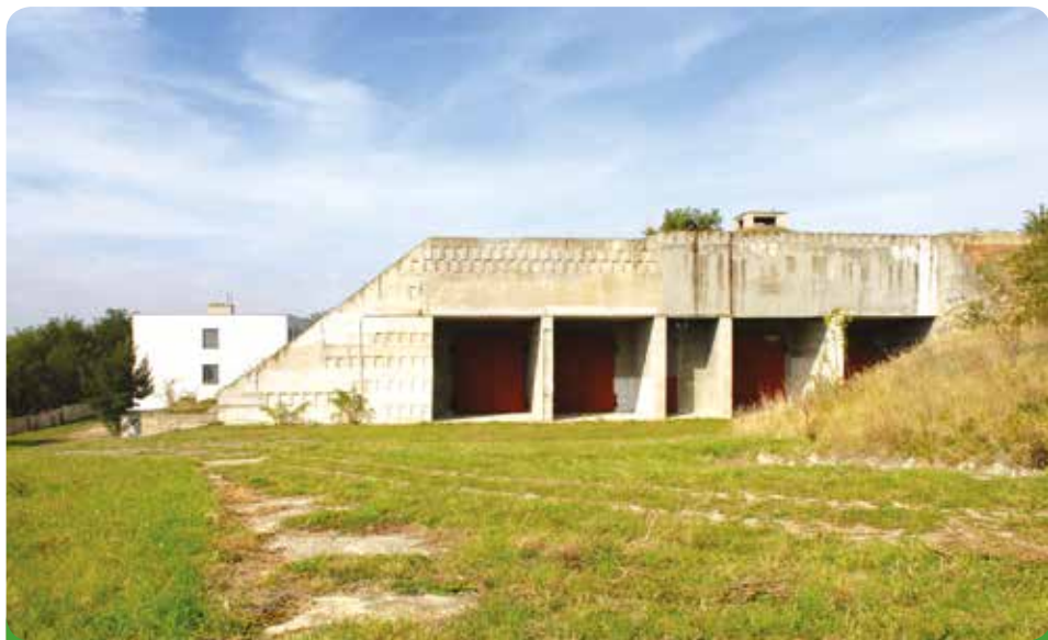
Bývalý vojenský areál v majetku města, převedeno bezúplatně