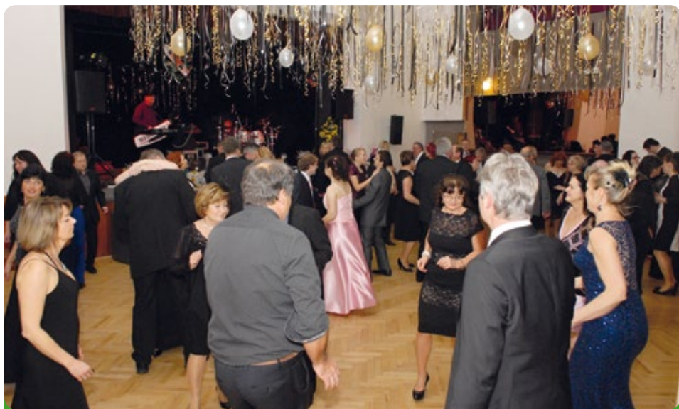
XI. Reprezentační ples města, konaný dne 23. 1. 2015 ... také se bavili