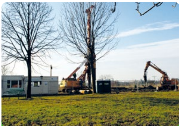
Stavba domova důchodců započata