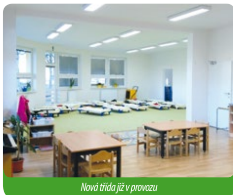
Nová třída již v provozu