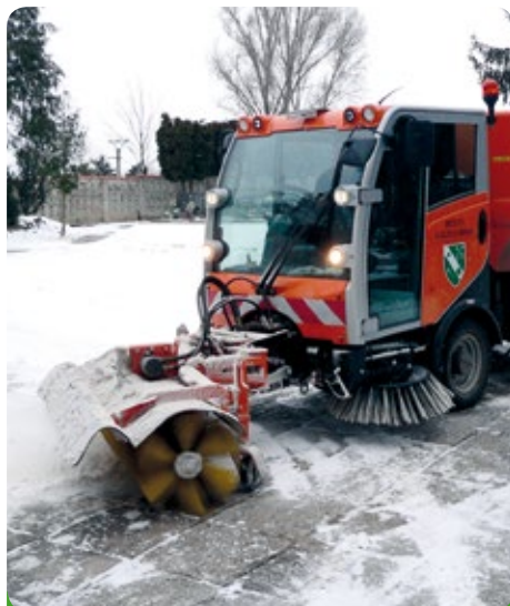
Nový kartáč na sníh v akci