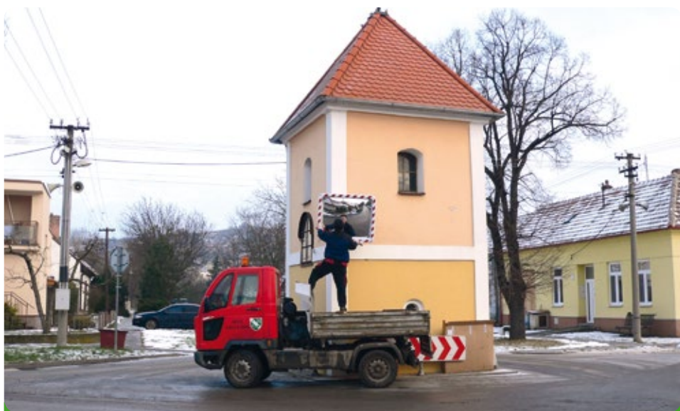
Nové vyhřívané zrcadlo