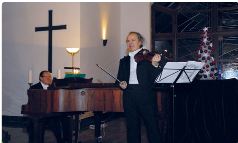
Houslový virtuos Václav Hudeček