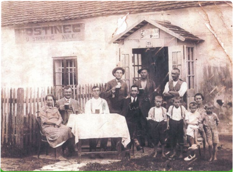
Zbouraná restaurace na místě Stříbné koule

(Další text byl při vyzvednutí schránky v roce 2002 vlhkem v porušené schránce zničen, takže ho nebylo možno přečíst.)