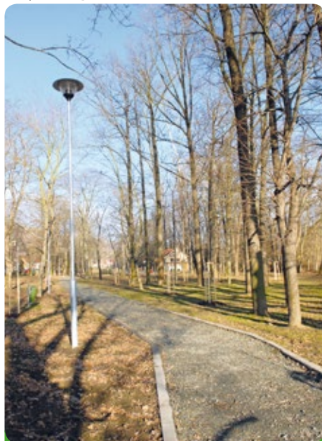
Park u koupaliště po revitalizaci