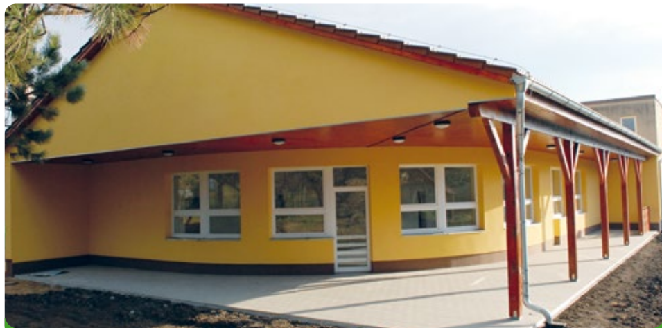
Přístavba mateřské školy jedné třídy

Odstranili jsme nedostatek místa v mateřské škole. Pál bych Vám vidět a slyšet, co vytykala opozice při projednávání, když rozhodovali o tom, zda přistavět či nepřistavět mateřskou školu tak, aby byla dostačující kapacitou. Největší nepravdivý argument byl, že nebude třeba rozšiřovat kapacitu mateřské školy, protože ubývá porodů. Pravda byla jinde a bylo dobře, že jsme se nenechali