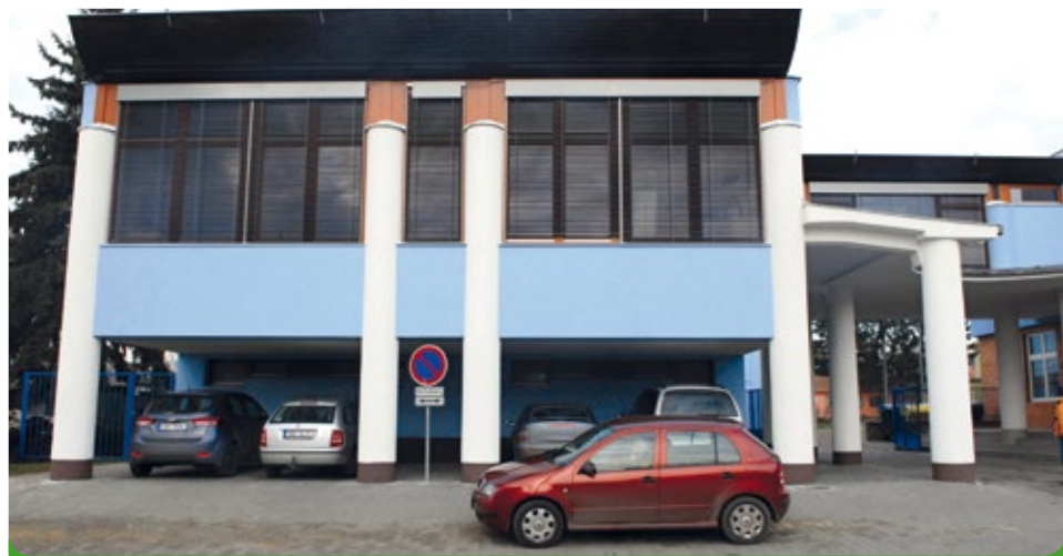
Již zateplená tělocvična s výměnou oken a žaluzií