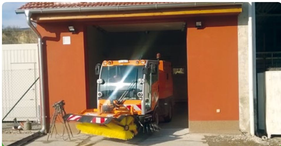
Nová vyhřívaná garáž pro nové zametací auto