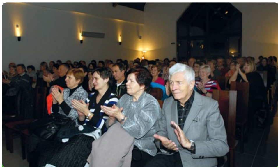
Adventní koncert, konaný dne 11. 12. 2014