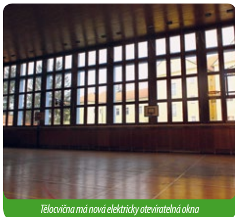
Tělocvična má nová elektricky otevíratelná okna

Za ten čas bylo vykonáno hodně práce, tak se pokusíme získat opět nějaké dotace na další potřebné stavby a rekonstrukce v našem městě.