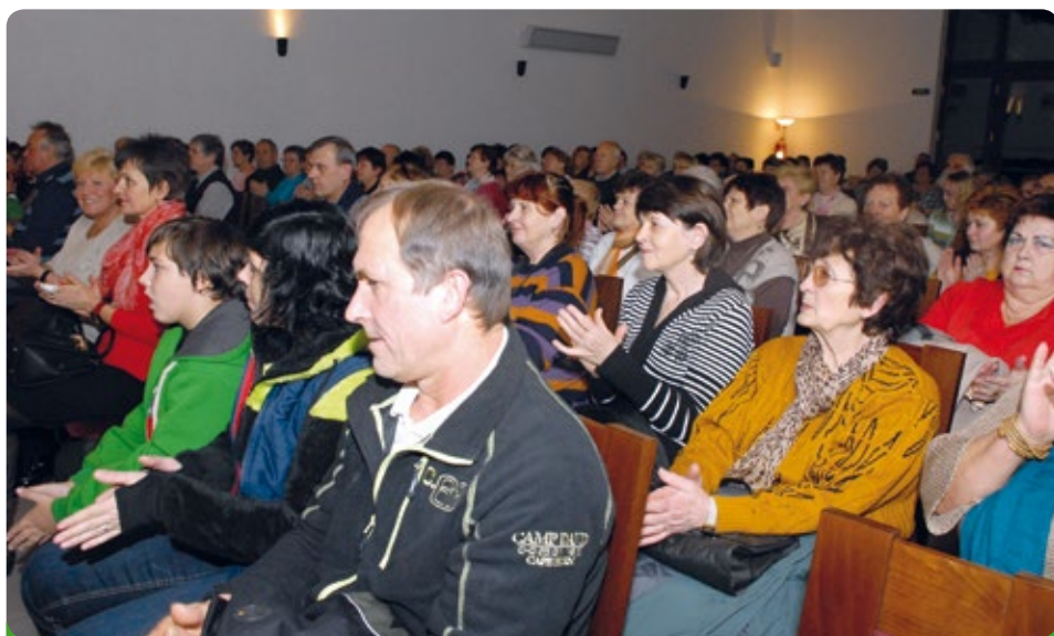
Adventní koncert, konaný dne 21. 12. 2014