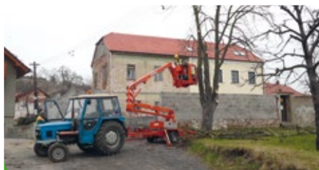
Ořez nebezpečných stromů v ulici Sušilova

Profesionalizace naší pracovní skupiny nám dnes umožňuje, abychom ušetřili asi 120.000,- Kč ročně. I tak to nebylo zcela jednoduché. Museli jsme zakoupit plošinu na práci ve výškách, nechat zaškolit pracovníky města a problém byl vyřešen.