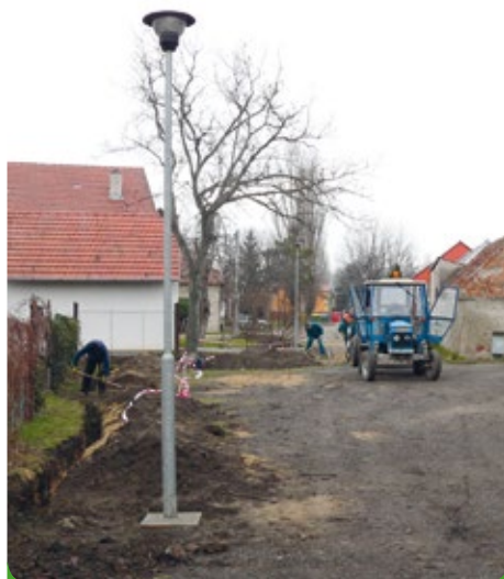
Nové veřejné osvětlení

Veřejné osvětlení MB Real a lokalita za „Rychtou“ stálo 25.863,63 Kč.