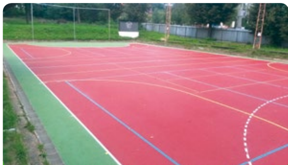
Nové házenkářské hřiště za sokolovnou

Pamatovali jsme i na TJ Sokol Újezd u Brna. Dne 23. 9. 2014 město Újezd u Brna poskytlo částku ve výši 700.000,- Kč. Pomohli jsme TJ Sokol s výběrovým řízením na dodavatele, který stavbu realizoval a podívejte se, jak to dobře dopadlo.