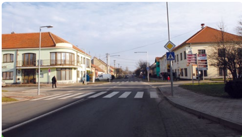
Nový průtah městem včetně parkovacích míst a přechod s osvětlením. Povedlo se!