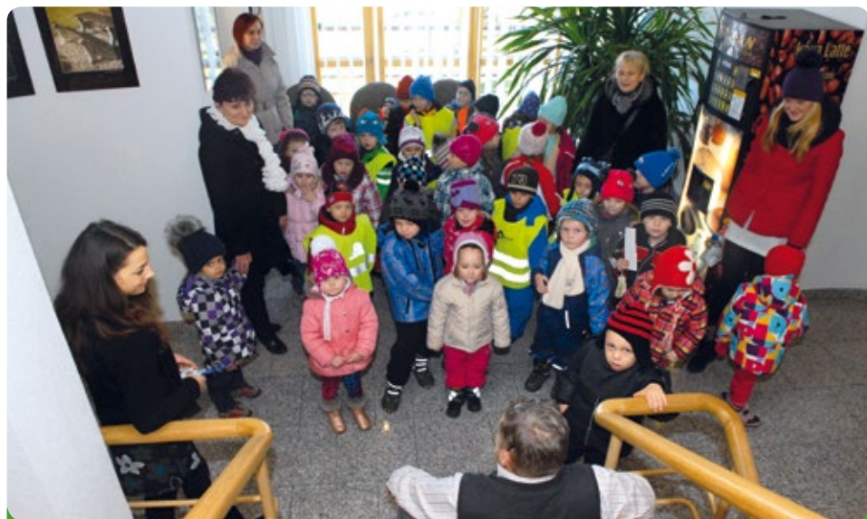
Vánoční přání dětí z MŠ na radnici dne 17. 12. 2014