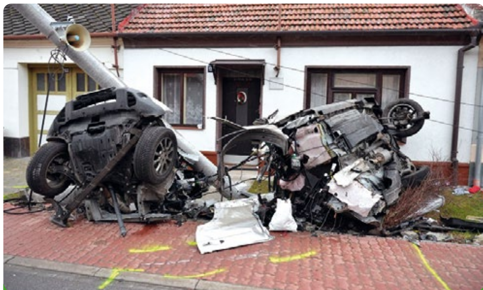
Havárie na ulici Štefanikova dne 26. 12. 2014