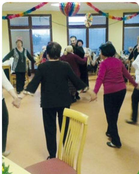
Papučový bál pro naše seniory,