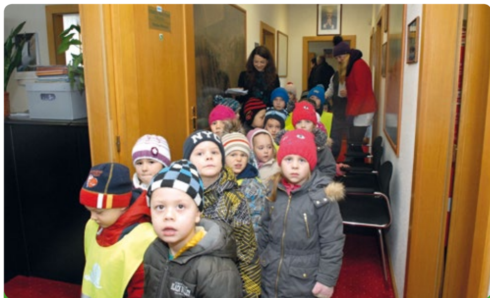
Děti z MŠ přišly popřát v předvánočním čase