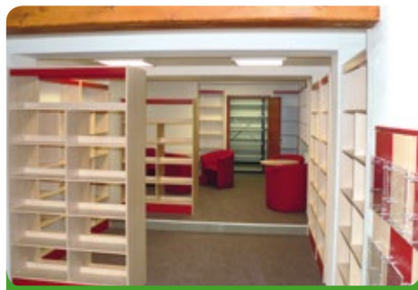
Nový nábytek v nové knihovně