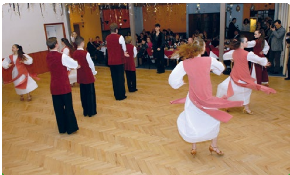
Předtančení – taneční klub Taneční školy Starlet