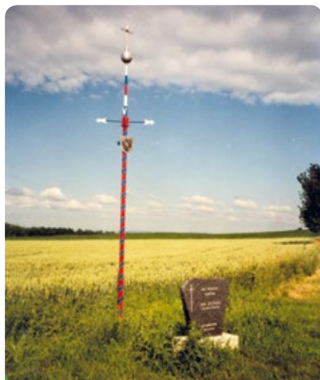
Lokalita U Stříbrné koule

Když obytná i hospodářská stavení se již příliš přiblížila ke kříži a jej zastíňovala, rozhodla se šternovská obecní rada s obecním zastupitelstvem , že kříž tento přeloží na vhodnější místo, na obecní místo u mostu u řeky Cézavy, na parcelu šternovskou č. 54/16, uznává závazek, že částka tohoto pozemku ve výměře dvaceti