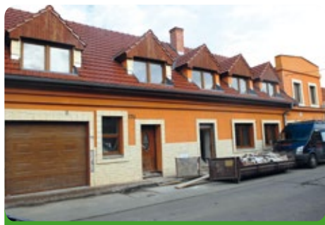
Fasáda knihovny ještě před rekonstrukcí

Air Clim, spol. s r.o., Brno za: 98.371,- Kč bez DPH.