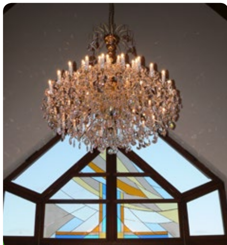
Osvětlení v Obřadní síni města je dokončeno. Po rozhodnutí Zastupitelstva města byl lustr objednan a dodala jej firma Honor