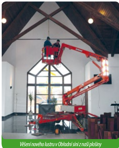
Věšení nového lustru v Obřadní síni z naší plošiny