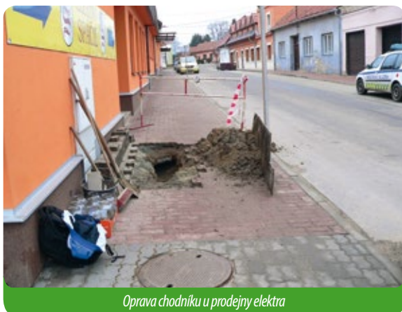
Oprava chodníku u prodejny elektra

Pod novými chodníky se několikrát do roka objeví „kaverna“, a pak se chodník propadne. Je to krajně nebezpečné. Naše pracovní skupina však s tím má již zkušenost. Jedno je ale jisté – pod starou částí Újezdu jsou staré nezasypané sklepy, které zasahují do chodníků. Již jsme řešili tři případy.