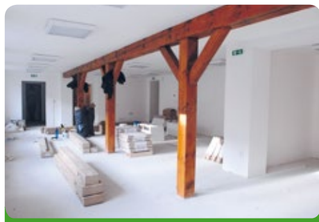
Knihovna před dokončením