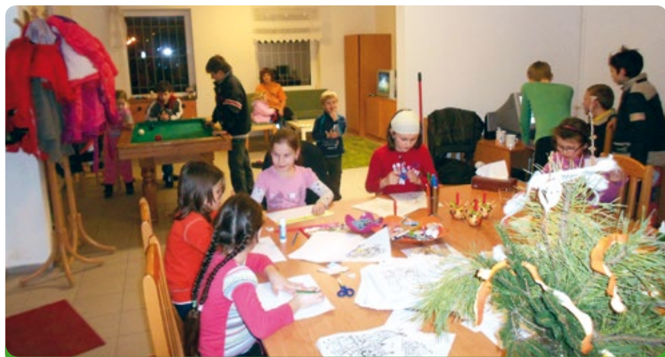
Činnosti v klubovně pro mládež