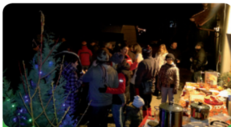
Rozsvícení stromečku (3.12.2011)