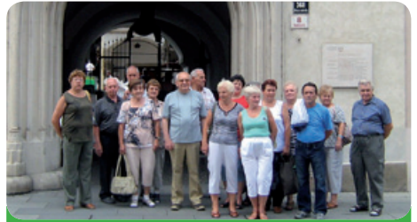
Výlet diabetiků do podzemí