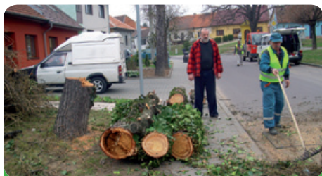
Modřiny v Sádku