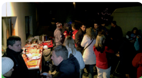
Rozsvícení vánočního stromku na ulici Příční