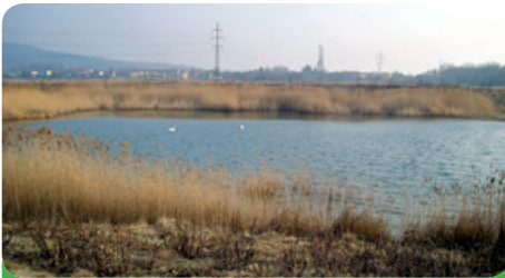
Šmolcus a jeho přirozená krása

Když se podíváte na obce podobné velikosti, tak mnohdy z nich musí prodávat svůj majetek, pozemky, aby ekonomicky udržely chod obce. My pro změnu stále a stále nakupujeme pozemky, či budujeme nové nemovitosti. Újezdská skládka je dnes opětovně zařazena mezi ošetřené recyklované pozemky, vždyť déle než cca 140 let tam každý, kdo mohl, navezl od stavební sutě až po chemické odpady cokoliv. Na tuto skládku jsme vysadili 1 500 stromů a keřů. Vznikne tam krásný háj. Ale bude to pochopitelně pár desítek let trvat. Radovat se z toho budou až naše děti. Můžeme se však podívat na druhou stranu katastru města. Například Šmolcus, dnes je tam opravdu krásný mokřad s rybníčkem, ale i zde je vysazeno přes 1 000 nových sazenic stromů a keřů. To vše se musí okopávat, na zimu ošetřovat, je za tím ukryto mnoho práce, která není vidět. I zde jednou bude překrásná část újezdského katastru. Rovněž na to jsme dostali dotace z Evropských fondů. O těchto místech jsem hovořil zcela úmyslně, abychom si uvědomili, že to bylo místem, které volalo po rekonstrukci. Byly tam vyvezeny staré