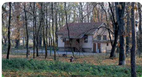
Klubovna pro mládež v parku u koupaliště