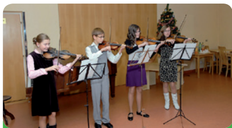
Housličky v DPS – koncert (11.12.2011)