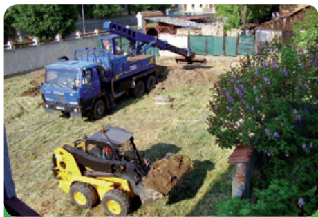
Odpočinková zóna - Park JUDr. Jana Haluzy (květen 2011)