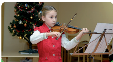
Housličky v DPS – koncert (11.12.2011)