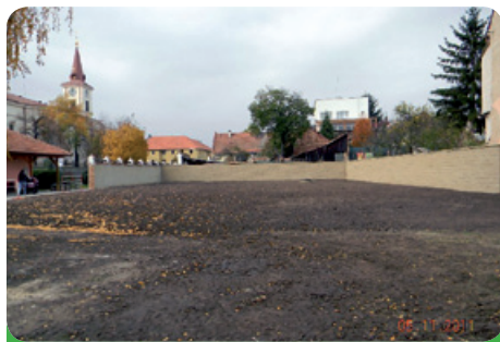
Odpočinková zóna - Park JUDr. Jana Haluzy (5.11.2011)