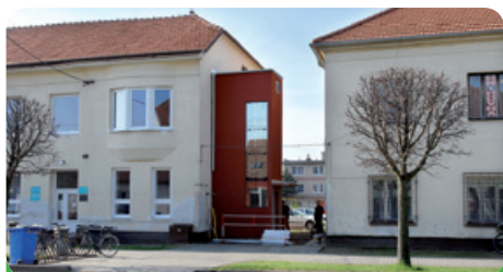
Výťah pro zdravotní středisko