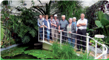
Výstava masožravých rostlin