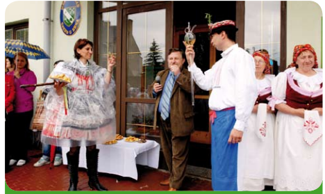
Babské hody začínají - předání Babského práva (22. 05. 2010)