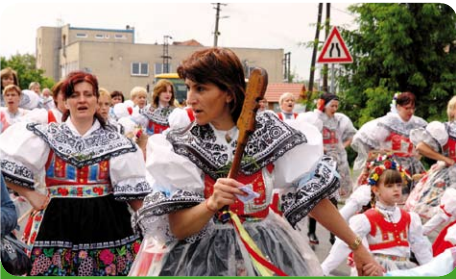
Už zase někoho diriguje