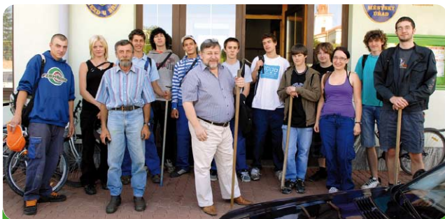
Po vyhlášení brigády městem se sešli zájemci o práci