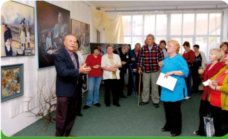
Výstava J. Červinky ve Vzdělávacím centru U Kapličky