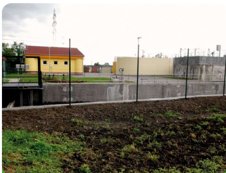
Takto vypadá čistička z boku

Několik fotografií ze dne otevření dveří 13. 09. 2010.