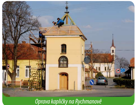
Oprava kapličky na Rychmanově

Kaplička na Rychmanově potřebovala střechu. Byla opravena v tomto desetiletí již podruhé. Osazení okny, dveřmi,