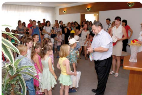
Slavnostní zakončení školního roku dětí, které jdou ze školky do školy