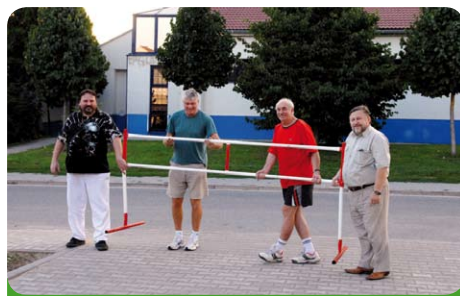
Otvíráme parkoviště za poštou