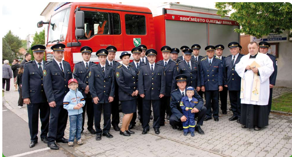
Pan farář požehnal nejenom novému autu, ale i všem ostatním