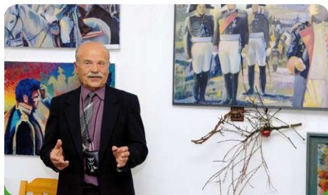
Výstava J. Červinky ve Vzdělávacím centru U Kapličky