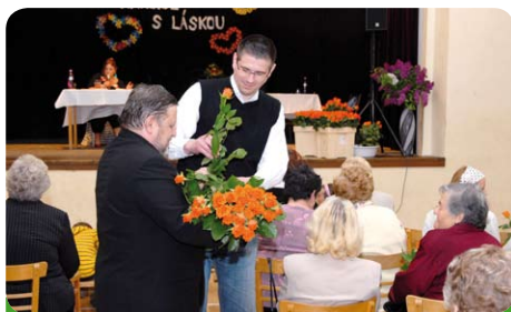
Svátek matek 08. 05. 2010