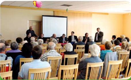
ČSSD projednává problematiku stáří (21. 05. 2010)