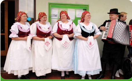
Zpěvačky na Babských hodech