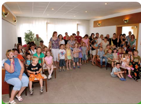
Děti z MŠ a jejich rodiče na MěŮ na konci školního roku