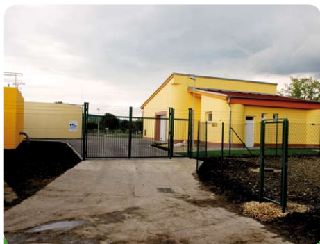
Den převzetí díla nové čističky od firmy Pozemstav Brno

Takto vypadá naše nová čistička odpadních vod. Posudte sami, zda se dílo povedlo.