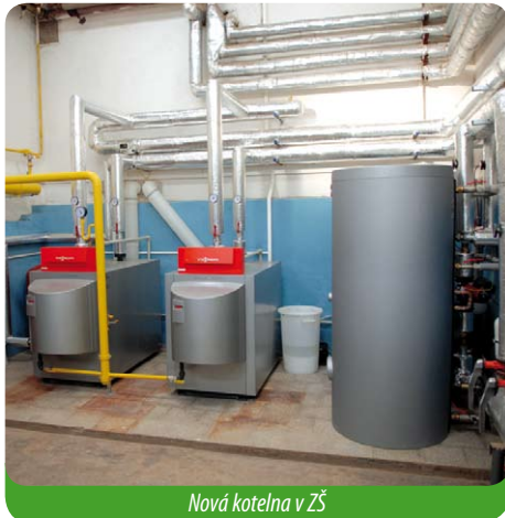
Nová kotelna v ZŠ

Dokonce jsme na rekonstrukci školní kotelny obdrželi z JMK dotaci.