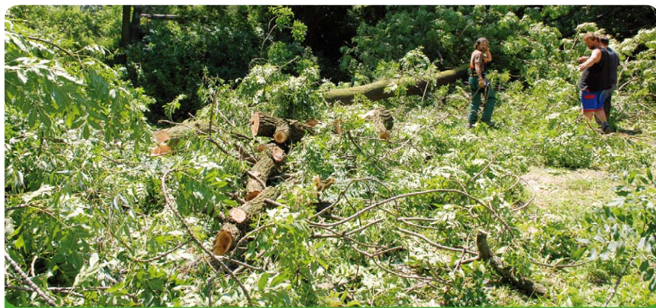
I u nás došlo ke kalamitě (27. 06. 2010)