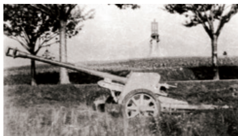
Mohyla s dělem r. 1945