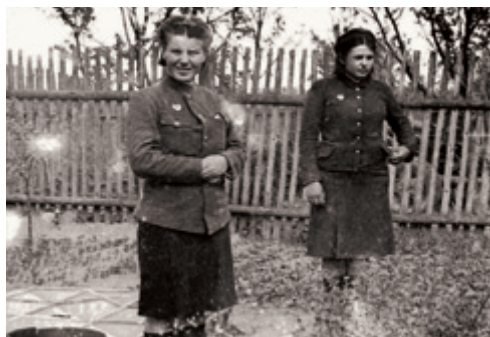
Dvě ruské dívky r. 1945