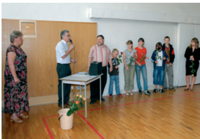
Tito žáci pravidelně navštěvovali schůzky ekotýmu, zpracovali audit školy, reprezentovali školu na setkání Ekoškol, podíleli se na třídním odpadu ve třídách

Cena ředitelky školy PaedDr. Jaroslavy Olšanské Ekotým