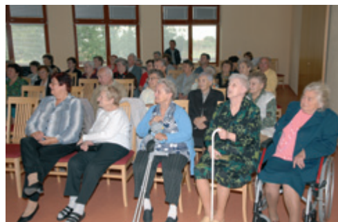
Papučový bál v DPS dne 9. 9. 2007