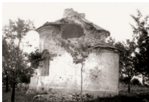
Kaple sv. Antonína po zásahu