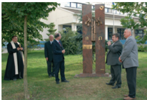
Slavnostní odhalování sochy Krista Salvátora