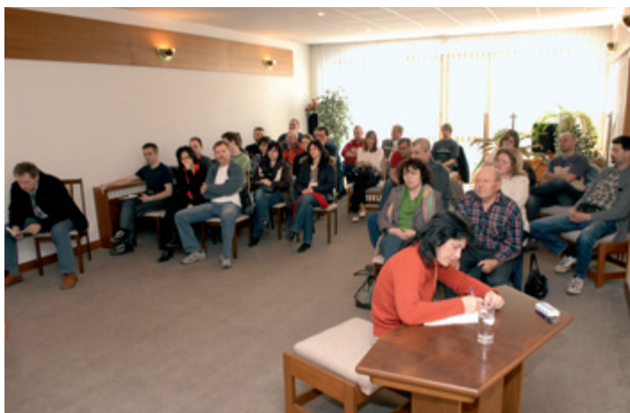
Porada obyvatel vojenské bytovky Na zahrádkách dne 15. 3. 2008