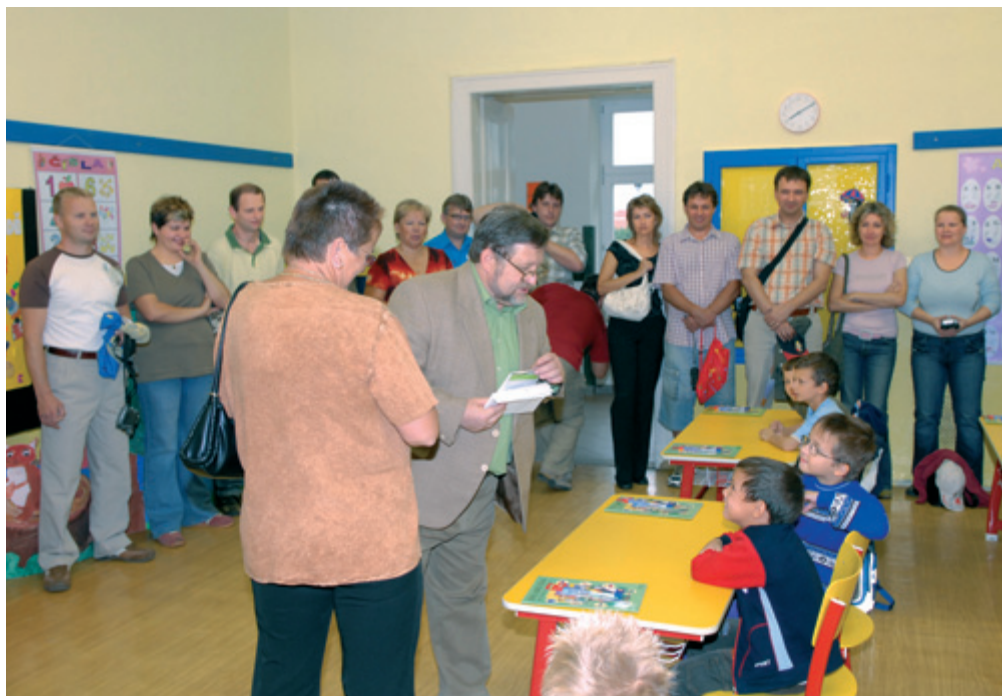
Pan starosta rozdával prvňáčkům pastelkovné