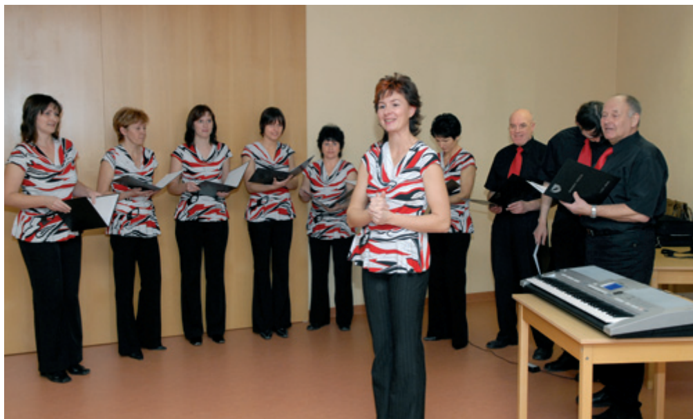
Eminent vocal dne 15. 12. 2007 v DPS