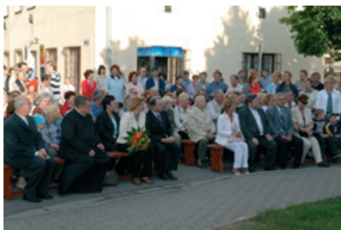
Účastníci odhalení sochy