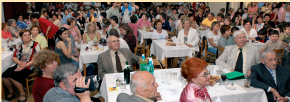
Svátek matek v Sokolovně