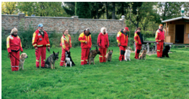
Memoriál 12.–14. 10. 2007