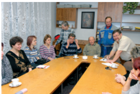
Školení bezpečnosti práce