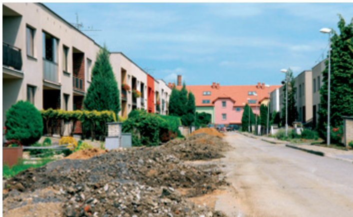
Kanalizace Na zahrádkách – průběh