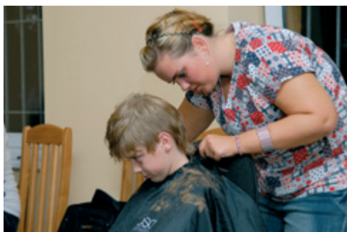
Klubovna mládeže stříhání