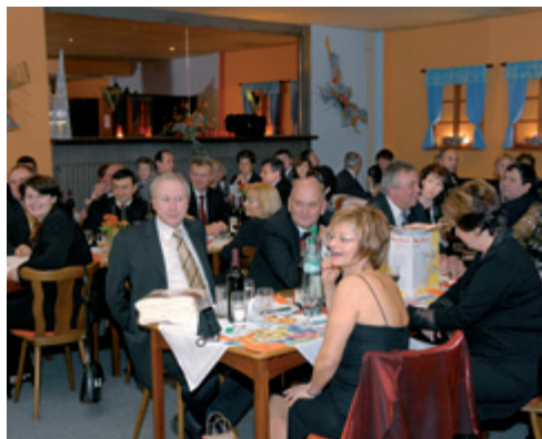
IV. městský ples

Městský reprezentační ples již v pořadí čtvrtý se konal v restauraci Na Rychtě, která prodělala rekonstrukci a bylo poznat, že noví nájemci si dali záležet. Čistota, nová kuchyně v nerezce doplňovaly svým prostředím i program, zaplněné prostory svědčily o velkém zájmu. Účastníky překvapila také velikost řízků podávaných jako večeře. Byl to ples se vším všudy, včetně tomboly.