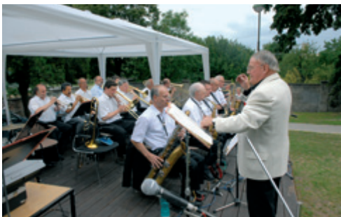
Koncert v parku 29. 6. 2007