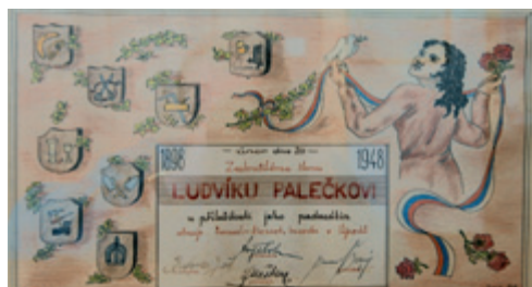
Obraz Ludvík Paleček