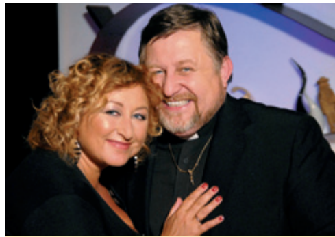
Je otázka, jestli je správné, že se starosta takto baví...

Anonymy – je opravdu hrozný zvyk posílat nepodepsané dopisy. Je to trochu více než zarážející, když má soused něco proti svému sousedovi, je lepší si to navzájem vyříkat, než poslat anonym. Bohužel se to stává. A tak všem těm, kteří nejsou schopni podepsat svůj dopis, sdělujeme, že se anonymy nebudeme zaobírat. Není to korektní podání. Je to dokonce více než smutné.