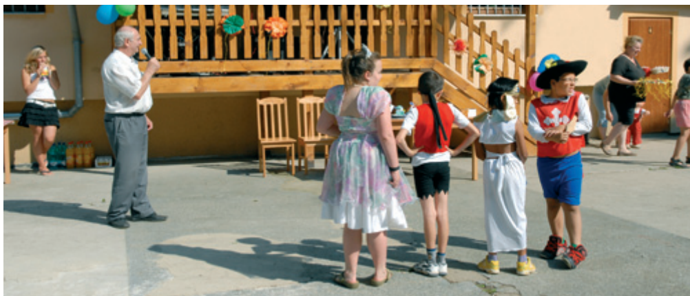
Klubovna mládeže v parku – den dětí

Už zase funguje klubovna mládeže včetně nového skateboardového hřiště. Jsou tam různá podujetí. Hry, výuka na počítačích, v přízemí se nacvičuje hudba, která starším nic neříká, avšak to, co se odehrálo dne 13. 10. 2007, bylo zcela mimo program – tak jsme je ostříhali... Město Újezd u Brna uhradilo kadeřnici, která bezúplatně ostříhala dobrovolně zájemce. Z třiceti vlasatých se vyklubali najednou hezcí, ostříhaní, upravení jak do tanečních. Naši klubovnu mládeže spravovaly 3 vychovatelky. V průběhu jednoho roku však postupně odcházely – kam jinam než na mateřskou.