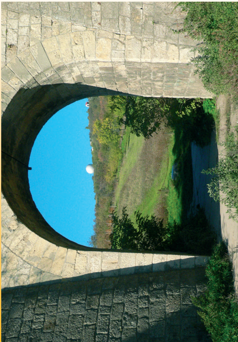
Vyšlo ranní sluníčko i s radarem