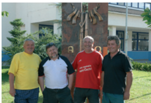
Tito 4 přiložili ruku k dílu