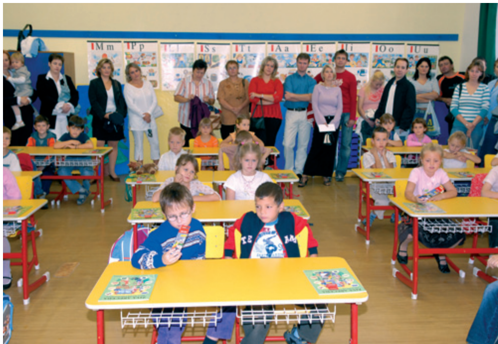
První hodina prvňáčků ve škole

školy 24.000.000 Kč . V předloňském roce 2006 byla zbudována školní výuková kuchyně. V loňském roce 2007 zcela nová chemická učebna za 600.000 Kč . Nyní se připravuje nová třída, ve které by děti měly trávit svůj volný čas (družina). Avšak ani interiér školy není úplně v pořádku. Nábytek pamatuje ještě čas, kdy mnozí dnes 40letí chodili do školy. Vždy, před koncem roku, rekapitulujeme náš rozpočet a pravidelně vybavíme 2–3 třídy novým nábytkem, novou podlahou včetně vymalování. Mylně se domníváme, že škola má v podstatě všechno, co by měla mít. Poslední návštěva z hygieny zkonstatovala, že tabule nejsou dobře osvětlené. A tak jsme do všech tříd koupili speciální osvětlení tak, aby si vaše děti nekazily oči. Bylo provedeno výběrové řízení, nebudete věřit, ale na stejný projekt přišly 3 návrhy. První 220.000 Kč, druhý 246.700 Kč a třetí 96.000 Kč. Tato skutečnost nás zarazila. Jak je možné, že za stejnou práci mohou být tak velké diametrální rozdíly. Zakázku dostala ta nabídka, která byla 96.000 Kč za patnáct tříd, představte si, že to svítí! J. H.