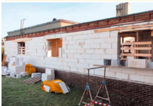
V naší mateřské škole probíhá přestavba