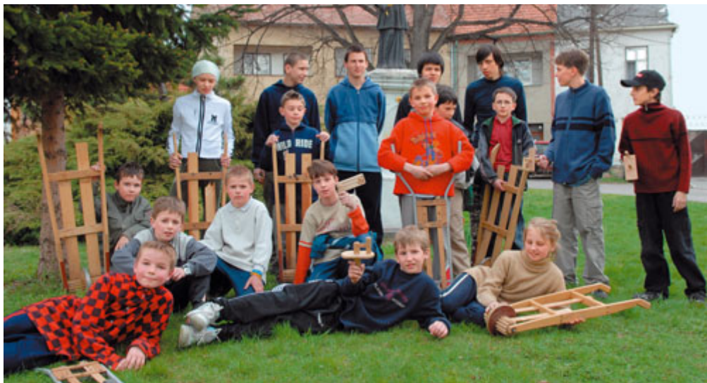
Nezapomínáme na staré krásné zvyky