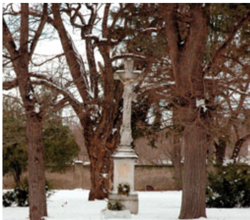
Starý hřbitov v zimě