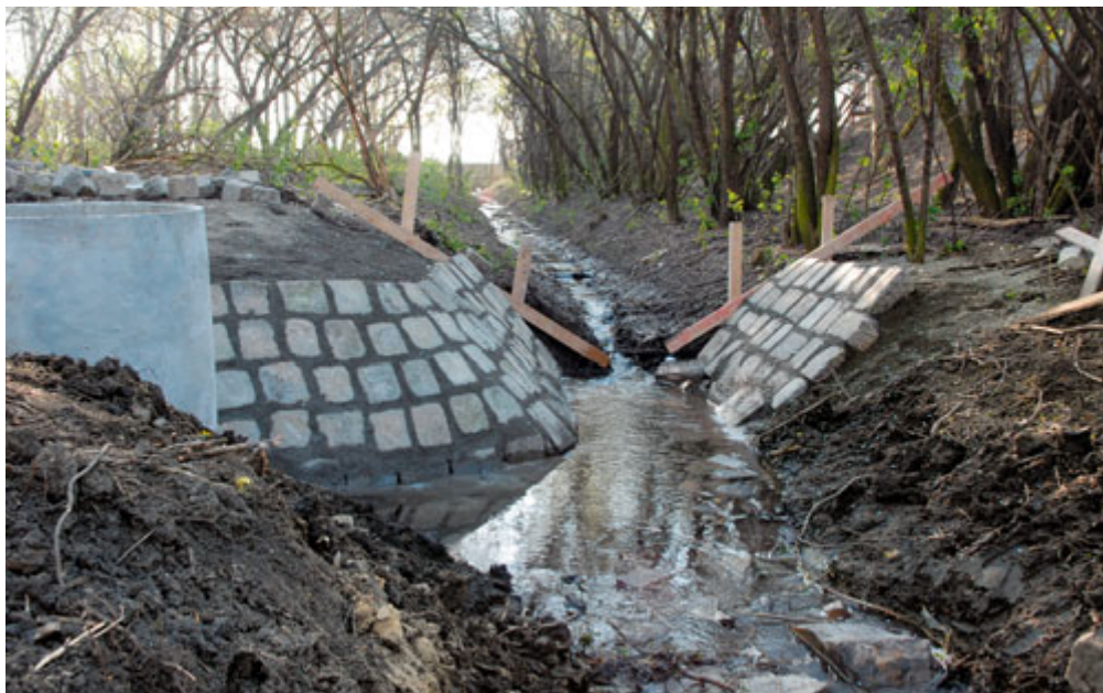
Právě probíhá rekonstrukce přítoku vody do rychmanovského rybníka (firma Colas)