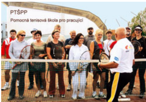
Pomocná tenisová škola