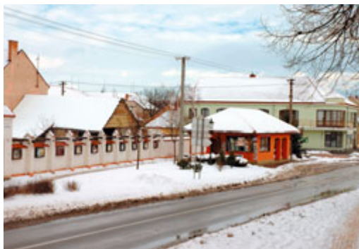
Letošní krátká zima