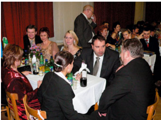
Naši hosté na plese