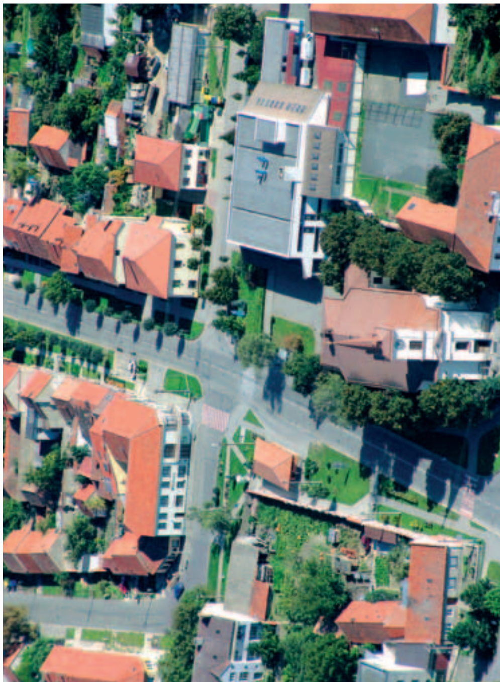
Střed města s budovou radnice