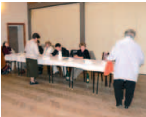
Členové okrskové volební komise pro volby do zastupitelstev obcí 2006 – okrsek č. 2 měl volební místnost v sále restaurace Na Rychtě.