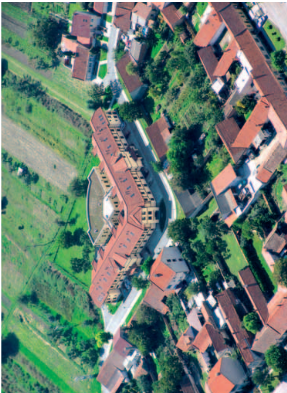
Dům s pečovatelskou službou na Rychmanově – čelní pohled