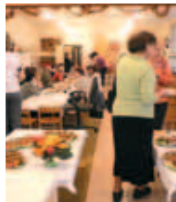
To nejlepší na konec – občerstvení