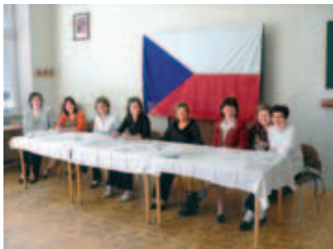
Členové okrskové volební komise pro volby do zastupitelstev obcí 2006 – okrsek č. 1 měl volební místnost v základní škole.