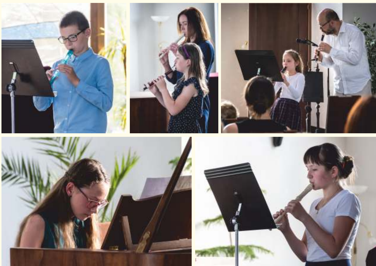
Koncert újezdských mladých talentů z brněnské ZUŠ

25. června byl v prostorách obřadní síně uspořádán další koncert újezdských mladých talentů , tentokrát těch, kteří navštěvují pobočku brněnské ZUŠ v našem městě. Zájemci na ní mohou studovat zpěv, hru na flétnu a kytaru. Mimo hudební vzdělání škola nabízí i výtvarný obor. Koncert, jakož i výstava výtvarných děl mladých umělců, měl velký úspěch.