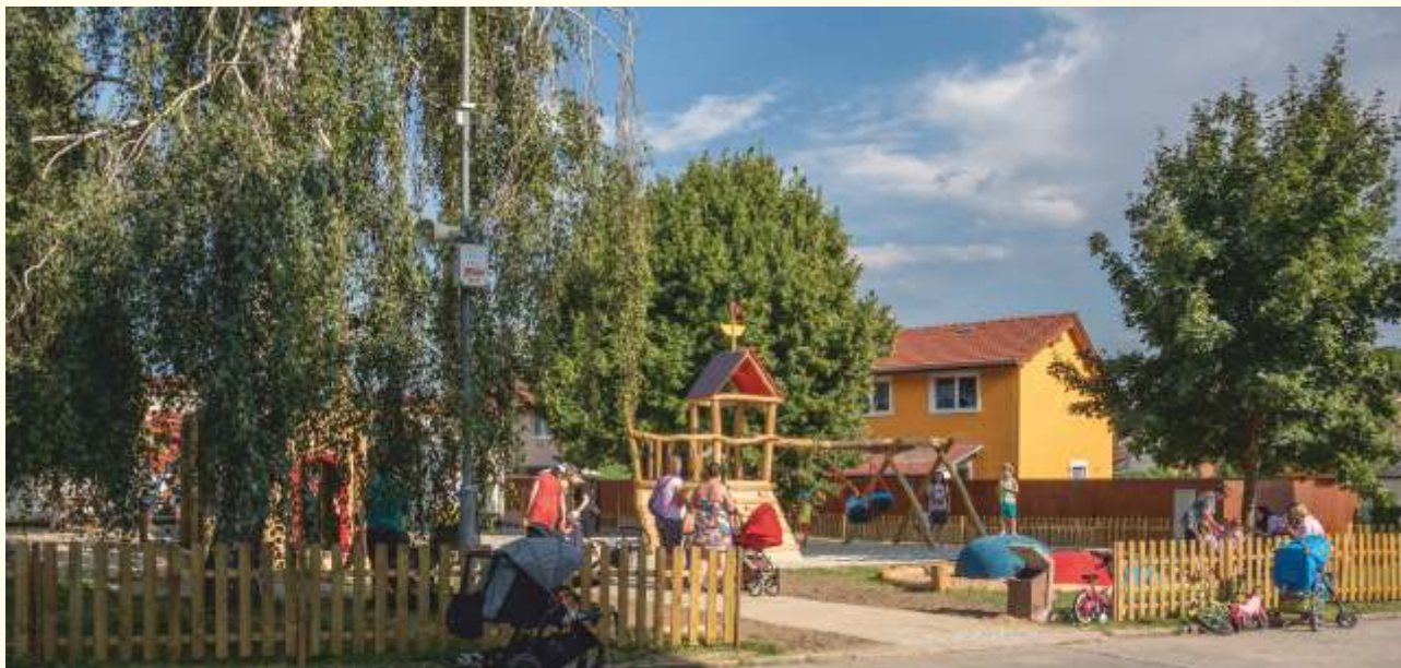
Nové hřiště Velryba Na Zahrádkách

Na Zahrádkách bylo na místě starého nefunkčního hřiště vybudováno nové, větší, s mnoha krásnými herními prvky. Jmenuje se Velryba podle pískoviště, ze kterého vykukují hřbety dvou kytovců. Bohužel již v první dny provozu bylo poškozeno neznámým vandalem. Škody byly napraveny a hřiště slouží k velké radosti rodičů, prarodičů i dětí.