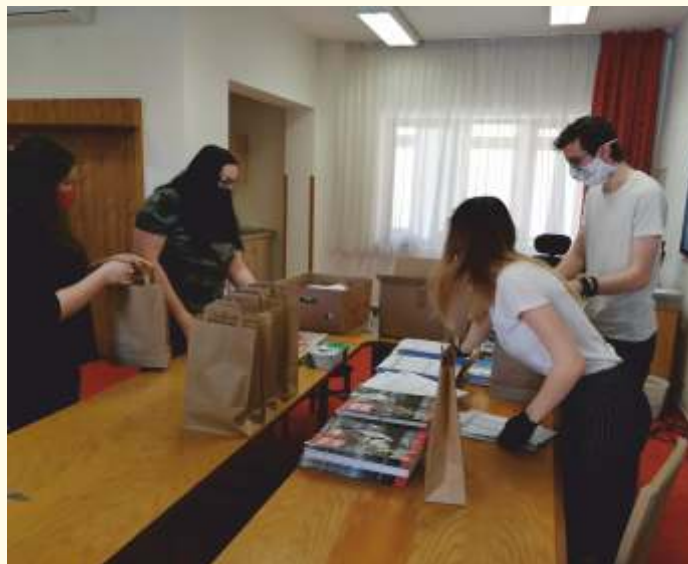
Příprava dárků pro seniory

V Domově U Františka se uskutečnila dobrovolná preventivní karanténa z důvodu ochrany zdraví a života klientů. Z přibližně dvou tisíc domovů sociálních služeb v ČR bylo pouze několik, kde se dobrovolné karantény uskutečnily. V domově, který funguje od r. 2016, je sto klientů, z nich 51 má trvalý pobyt v Újezdě u Brna, o všechny pečuje sedmdesát šest zaměstnanců – třetina z nich je z našeho města.