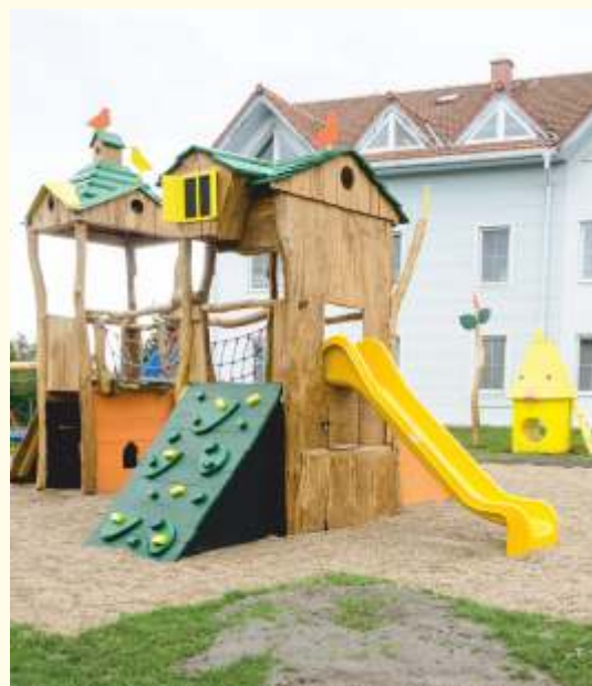
Dětské hřiště „Ptačí vesnička“