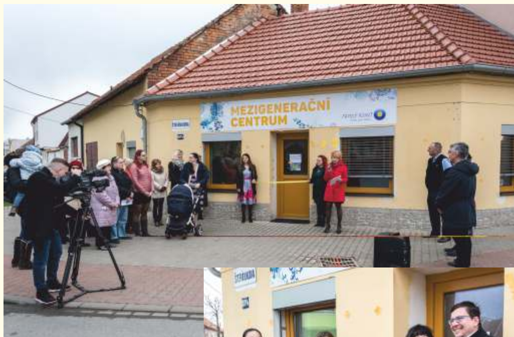
Slavnostní otevření Mezigeneračního centra a Family Pointu